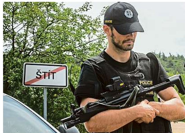
Policisté v akci, při níž chytali šelmy (více dole v boxu).

měsících podepisovaly denně stovky lidí a pravidelně je oznamovalo Rádio Svobodná Evropa i Hlas Ameriky. Jakeš chtěl dát funkcionářům návod, jak čelit ideologické diverzi, výsledkem ale byl tragi-