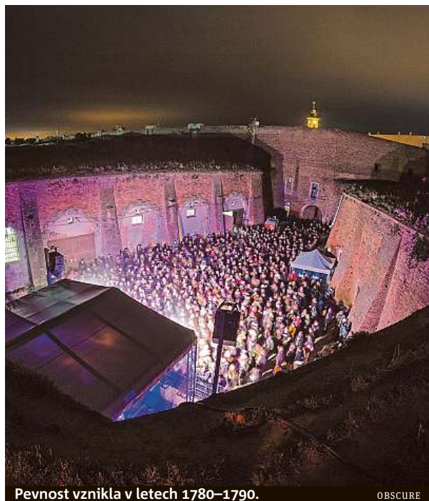
Pevnost vznikla v letech 1780–1790.

Festival Brutal Assault patří mezi největší metalové festivaly v Evropě. Vznikl v polovině 90. let jako malá akce na Moravě a často měnil místo svého konání. Přelom přinesl rok 2006, kdy díky atraktivnímu programu do Svojší u Přelouče dorazilo 7000 lidí. Rok nato se festival přesunul do Josefova, kde zůstal do současnosti. Poslední ročník festivalu, který se podařilo poprvé v historii vyprodat v předprodeji, přilákal 20 tisíc fanů z celého světa. Mnoho z nich se přitom samo podílelo v rámci dobrovolných akcí na obnově areálu. Cena vstupenky na všechny dny je 2300 korun. PETR HOLEČEK