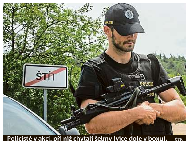
Policisté v akci, při níž chytali šelmy (více dole v boxu).

Asi nejvíc si naběhl, když si pletl slepice. „Přišel jsem k jedné pani, byla to bankovní úřednice, skončila v bance, její muž byl traktorista v družstvu, dělal v družstvu. Měli tam bojler, já nevím asi deset tisíc měli těch bojlerů, těch brojlerů, a měli sedm prasat, no,“ zní jedna z Jakešových ikonických vět. PH, HAL