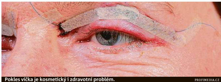
Pokleslá víčka je kosmetický i zdravotní problém.

„Plexr je vhodný spíše pro lidi, kteří z principu odmítají do přebytečné kůžičky řezat, anebo chtějí s klasickou operací ještě počkat. Někteří takto řeší i asymetrii víček, kdy jedno oko vypadá kvůli padajícímu víčku poněkud jinak než druhé,“ vysvětluje doktorka Koutná. MET