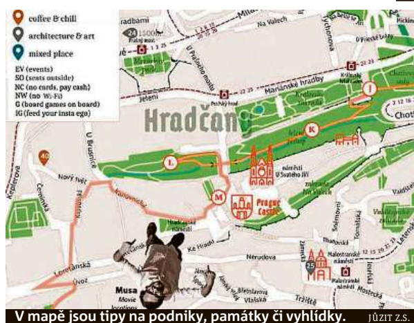
V mapě jsou tipy na podniky, památky či vyhlídky. JÚZIT Z.S.

Brožura vychází už po osmé a pokaždé se snaží přijít s nějakým zlepšovákem. „Do letošní mapy jsme nově zařadili kategorii Club, ve které doporučujeme cestovate-