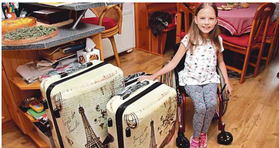
Dívka už má na cestu sbaleno.