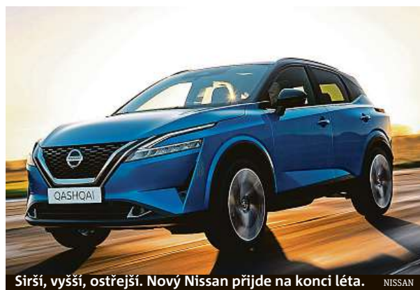
Širší, vyšší, ostřejší. Nový Nissan přijde na konci léta.

jako e-POWER. Bude získávat energii vzniklou rekuperací a ukládat ji do lithium-iontové baterie. Pak ji využije při startu motoru, akceleraci a v režimu plachtění. Vypíná