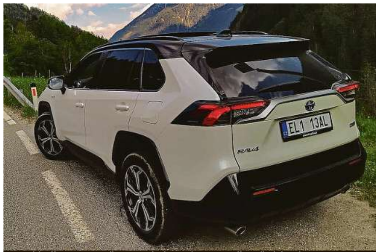
Ostrá holka. Zapomeňte na zakulacené tvary zadku předchozí generace.