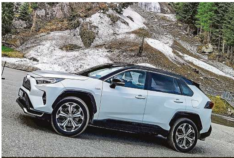
Ravka pózuje u dosud zamrzlého vodopádu Fragantbach v Korutanech.