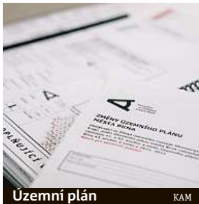
Územní plán KAM

Obě veřejná projednání budou mít stejný průběh. V první části představí zástupci města a Kanceláře architekta města obsah návrhu územního plánu. V následující fázi bude ponechán prostor veřej-