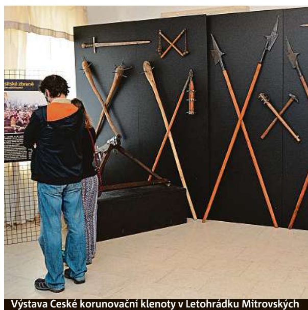
Výstava České korunovační klenoty v Letohrádku Mitrovských