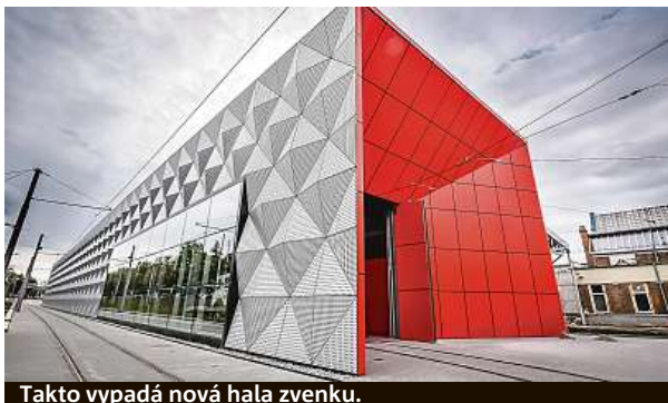
Takto vypadá nová hala zvenku.

V Pisárkách začala fungovat nová hala, která umožňuje důkladnější péči o tramvaje. Zrychlí se provoz i sníží hluk.