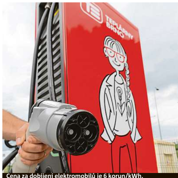
Cena za dobíjení elektromobilů je 6 korun/kWh.