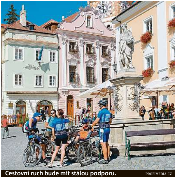
Cestovní ruch bude mít stálou podporu.

Z minulých let využije kraj přebytky ve výši 40 milionů