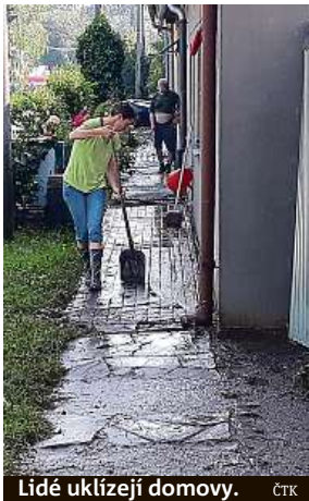
Lidé uklízejí domovy.

Dispečink ČEZ Distribuce evidoval v sobotu kolem deváté večer asi 34 tisíc domácností bez elektřiny a více než dvacet poruch na vedení vysokého napětí. Většinu se podařilo přes noc obnovit, zbylým několika stům domácností měli pak technici obnovit dodávky během neděle. Škody jdou do statisíců korun. Nejvíce problémů s dodávkami bylo na Náchodsku a Trutnov-