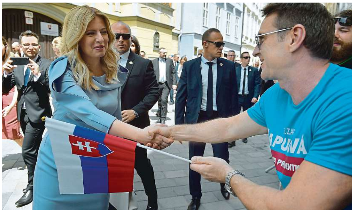
Nová slovenská prezidentka Zuzana Čaputová se zdraví s lidmi po sobotní inauguraci. Více čtete na straně 5.

Dotace. Lidé by byli ochotni o nákupu elektroauta uvažovat, pokud by existovala státní podpora. Německý model. Část peněz přihazuje stát, druhou automobilka. 703. Tolik nových vozů si vloni lidé pořídili STRANA 2