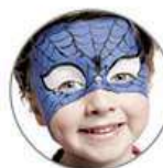
Malování na obličej

Upozornění: vzhledem k omezenému počtu parkovacích míst v Holešovické tržnici doporučujeme pro dopravu na akci využít MHD.