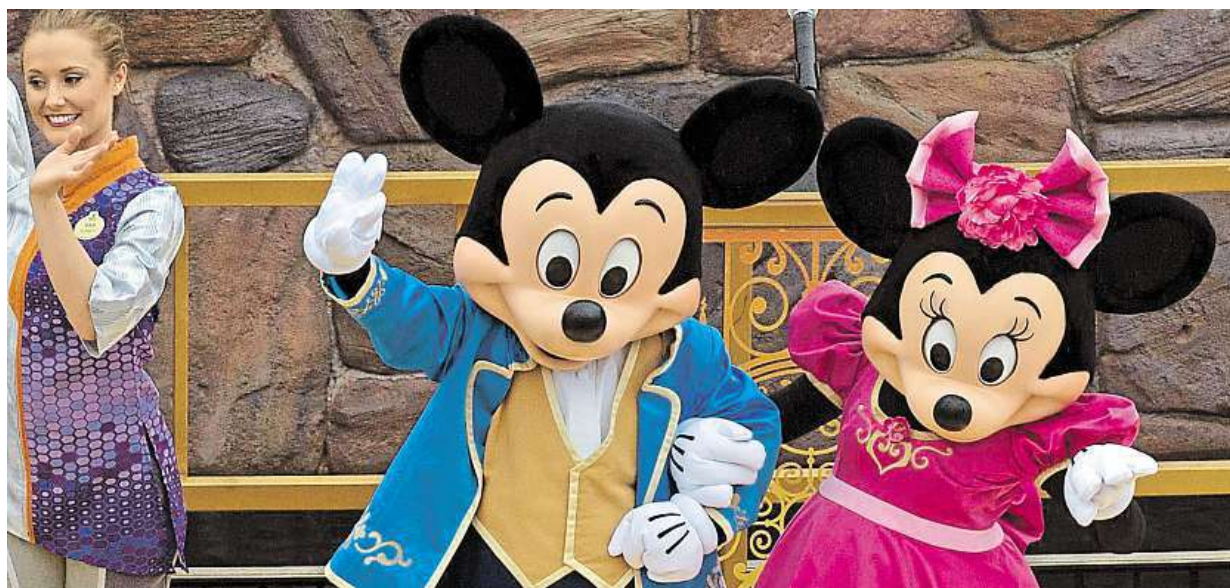
Celkově šestý Disneyland na světě, z toho třetí v Asii, včera konečně otevřel své brány v čínské Sanghaji. Stavěli ho pět let.

Elektromobily. Nový akumulátor stojí asi třetinu pořizovací ceny auta. Dojezd. Rada vozů ujeďe na papíře víc než ve skutečnosti. Investice. Při koupi auta na elektřinu potěší alespoň cena povinného ručení STRANA 2