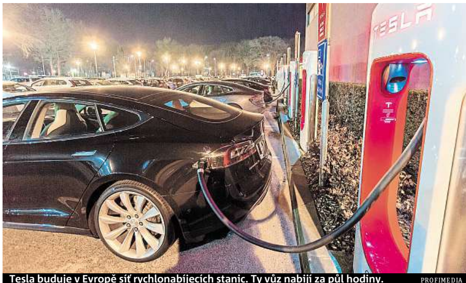
Tesla buduje v Evropě síť rychlonabíjecích stanic. Ty vůz nabíjí za půl hodiny.

Pokud se baterie používá, tedy pokud auto jezdí, tak se