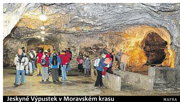
Jeskyně Výpustek v Moravském krasu