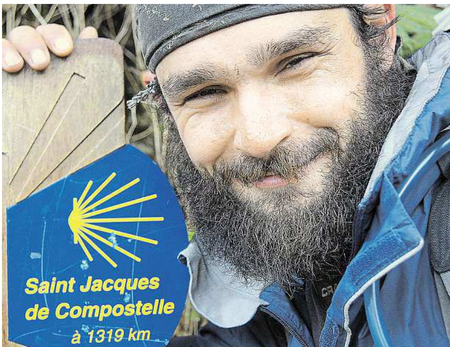
Vysněný cíl mnoha poutníků: cesta do poutního místa v Santiagu de Compostela

Ano, když jsem dorazil do Santiaga, tak jsem se sám sebe zeptal, jestli se chci vrátit domů, jestli už je ten čas.