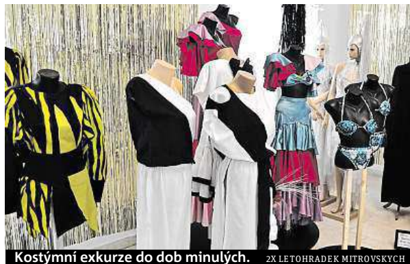
Kostýmní exkurze do dob minulých. 2X LETOHRÁDEK MITROVSKÝCH