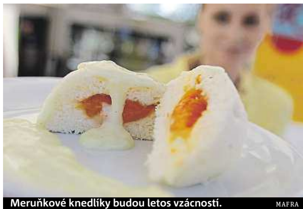
Meruňkové knedlíky budou letos vzácností.

Kdyby začalo pršet, mohla by být úroda podle sadařů o něco lepší než loni, ale spíše průměrná. „Sucho už poznamenalo květní násadu,“ uvedl Krejčířík. Lepší vyhlídky mají velkopěstitelé, kteří stromy uměle zavlažují, jako na Znojemsku podnik Pomona Těše-