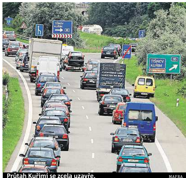
Průtah Kuřimí se zcela uzavře.

„Naprostou chápou, že lidé jsou z tolika překážek na cestě do práce frustrovaní, ale bohužel nebylo v našich si-