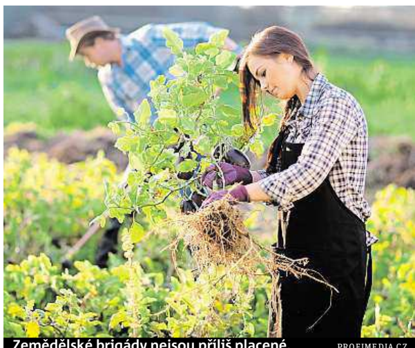
Zemědělské brigády nejsou příliš placené.

Největší zájem je podle Semeníkové o brigády, které jsou nejlépe placené a vyžadují nejméně dřiny, do této kategorie spadá například do-