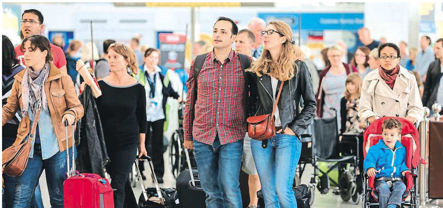
Passengers at Stansted Airport