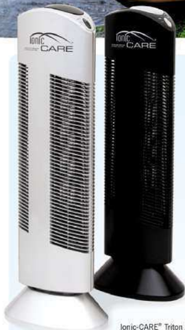
Ionic-CARE® Triton X6 Přístroj si můžete zvolit v černé, stříbrné nebo perleťové bílé variantě

Svěží vzduch z přírody do vašeho bytu či domu