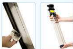
Filtry není třeba nikdy vyměňovat! Stačí je jen občas jednoduše vymout a otřít. Účinek filtrace ihned vidíte!

Víte, proč se na horách, v lese, u moře, u splavu či po bouři cítíte tak dobře? Vědci na to přišli. Je to proto, že na těchto místech je podstatně vyšší koncentrace zdraví prospěšných aniontů kyslíku (záporně nabitých kyslíkových částic) než ve městech, bytech a kancelářích. A víte, že při pobytu v moderním bytě nebo kanceláři nás obklopuje několikrát škodlivější vzduch než je venku?