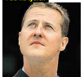
Michael Schumacher se zranil 29. prosince 2013 v Méribele.