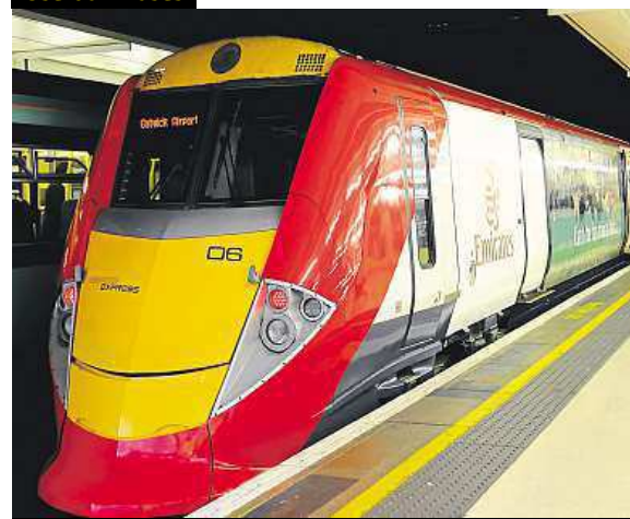
Gatwick Express runs to Victoria station every 15 min.

Re-arrange these words to make useful phrases for airports.