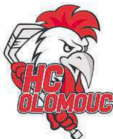
Nové olomoucké logo ČTK

Hokejisté Olomouce vstoupí do extraligy s novým logem. Jeho hlavním motivem je stejně jako dosud kohout, tentokrát ho ale doplňuje nápis HC Olomouc. Staré logo musel klub, který si letos po 17 letech zajistil postup mezi elitu, přestat používat. Autorská práva na něj získal v březnu v exekuční dražbě Jiří Dittmer a soud pak hokejistům zakázal jeho užívání. ČTK