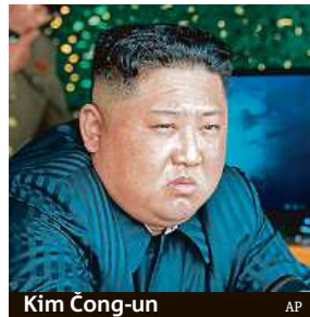
Kim Čong-un

Podle OSN potřebuje potravinovou pomoc v zemi až deset milionů obyvatel.