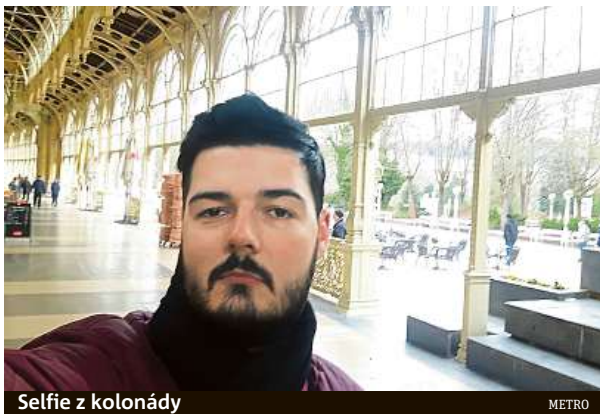
Selfie z kolonády

Jak poznala na vlastní kůži i část redakce Metra, jež sem vyrazila na dvoudenní výlet, čas tu plyne opravdu rychle. Pokud se zde totiž rozhodnete strávit dovolenou klasicky po lázeňsku, tedy odpočinkem, posedáváním po kavárnách a procházkami, hodně rychle zjistíte, že sem budete muset brzy zase. Polovinu míst, které jste měli v plánu navštívit, totiž v opojení klidně plynoucího lázeňského života vůbec