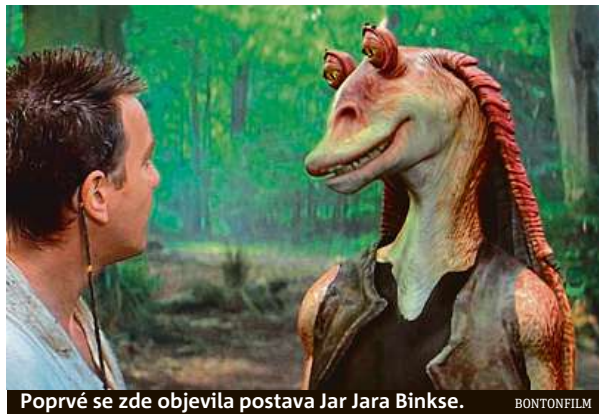
Poprvé se zde objevila postava Jar Jara Binkse.

Hvězdné války to neměly v posledním roce u horečně diskutujících fandů příliš jednoduché. Ačkoliv se například hračky z toho světa prodávají stále stejně dobře jako kdykoliv dříve, kvalita filmů a seriálů podle mnoha fandů kolísá. Vše má v následujících měsících zachránit nejen Abramsova Epizoda IX, ale také seriálový Mandalorian. Jeho děj má mapovat dobrodružství námezdního lovce Boby Fetta. V nejbližších letech jsou v plánu ještě dva další hrané seriály. Jako první dorazí Rogue One s Cassianem Andorem (Diego Luna).