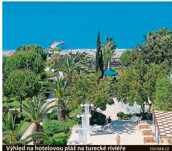
Výhled na hotelovou pláž na turecké riviéře