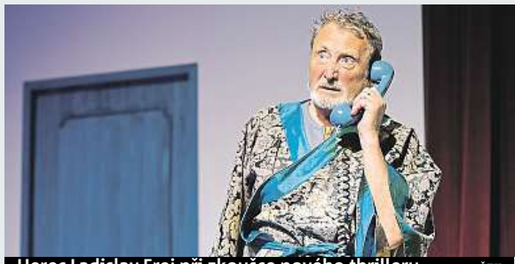
Herec Ladislav Frej při zkoušce nového thrilleru