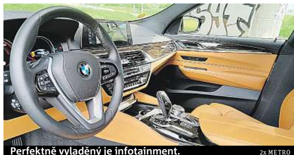
Perfektně vyladěný je infotainment.

Perfektně vyladěný je infotainment, který můžete ovládat gesty, stačí jen ve vzduchu zatočit prstem a snížíte