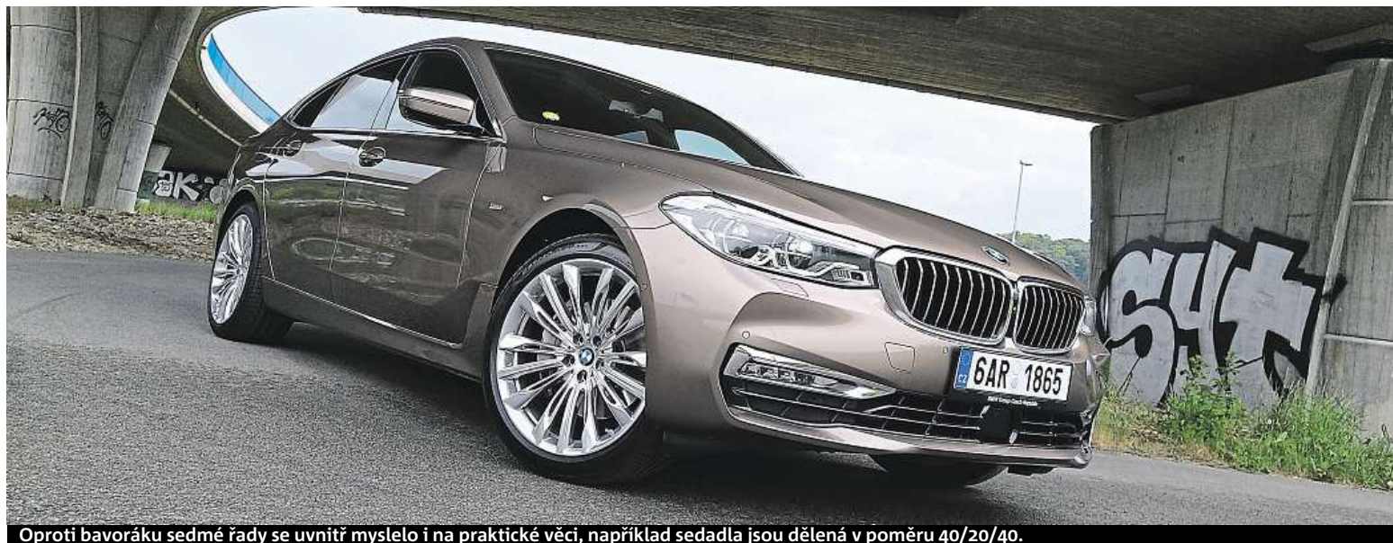
Oproti bavoráku sedmé řady se uvnitř myslelo i na praktické věci, například sedadla jsou dělená v poměru 40/20/40.

Konečně se vyvýšený sedan od BMW dočkal parádního designu.