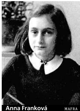
Anna Franková MAFRA

Muzeum zveřejnilo dvě stránky z deníku židovské dívky, jež zahynula v koncentráku.