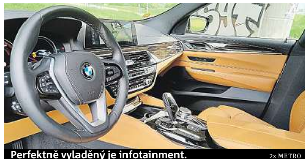
Perfektně vyladěný je infotainment.

Perfektně vyladěný je infotainment, který můžete ovládat gesty, stačí jen ve vzduchu zatočit prstem a snížíte