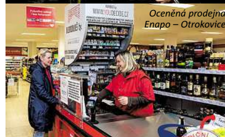
Oceněná prodejna Enapo – Otrokovice