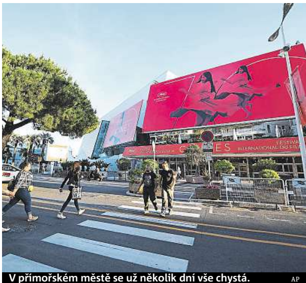
V přímořském městě se už několik dní vše chystá.

Projekcí nového filmu francouzského režiséra Arnauda Desplechina Ismaelovi duchové začne dnes jubilejní 70. ročník mezinárodního filmového festivalu v Cannes. Do hlavní soutěžní sekce letos bylo vybráno 18 snímků. Role předsedy poroty hlavní sekce se ujme španělský filmař Pedro Almodóvar, který sám místní ocenění Zlatá palma nedostal. Spolu s ním v devítileté porotě zasedne mimo jiné americký herec Will Smith, režisér Pak Čchan-wuk z Jižní Koreje, jenž na sebe loni upoutal pozornost filmem Komorná, a také jeho italský kolega Paolo Sorrentino, autor Velké nádhery či Mládí. Zahajovací ceremonii bude moderovat italská herečka Monica Bellucciová.