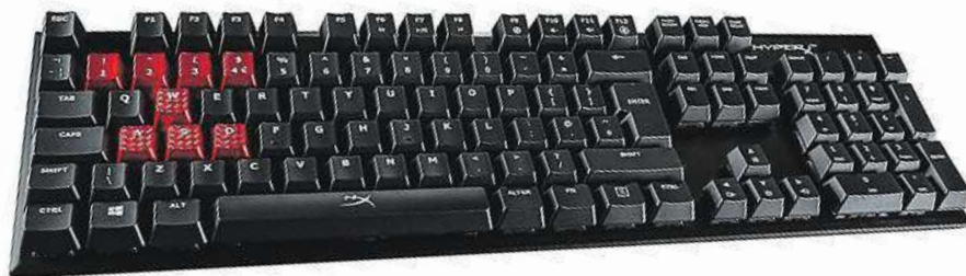
Herní klávesnice HyperX Alloy FPS