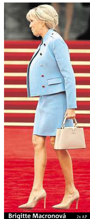
Brigitte Macronová 2x AP

První dáma se přes četné útoky může spoléhat na rostoucí podporu dokonce od takových mezinárodních hvězd, jako je Madonna. Ta na Instagramu zveřejnila poselství, v němž Macronovým blahopřála ke svobodě. „První dáma má o čtyřiašedesát let více než její manžel a zdá se, že se nikdo ve Francii nezajímá o jejich věkový rozdíl a nikdo po Brigitte nepožaduje, aby v souladu s tím jednala. Ať žije Francie,“ napsala zpěvačka. ČTK, MET