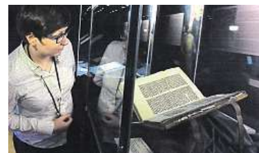
Kodex přijel z Pražského hradu. ČTK

1279, kdy si 5. ledna přední církevní hodnostáři dojeví pro stvrzení volby pražského biskupa k olomouckému biskupu Brunovi, kterého našli právě ve městě Ostrava. Kodex si lidé mohou prohlédnout jen do neděle. ČTK