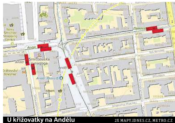
U křižovatky na Andělu