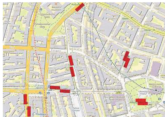
U stanice metra I. P. Pavlova a jeho okolí