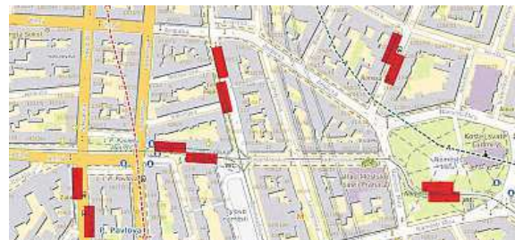
U stanice metra I. P. Pavlova a jeho okolí

o velmi diskutované téma, máme tedy za to, že je veřejnost dostatečně informována, nepřipravujeme proto