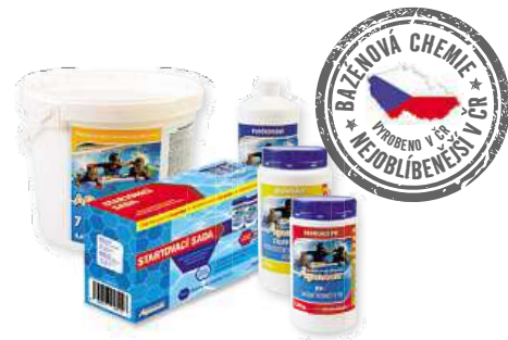
Bazénová chemie AQUAMAR