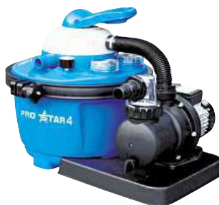
Písková filtrace PROSTAR 4