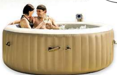
Vířivý bazén MARIMEX PURE SPA PLUS - BUBBLE HWS