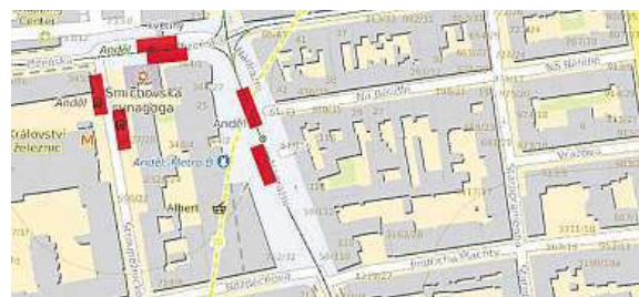
U křižovatky na Andělu