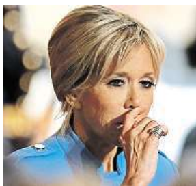
Při projevu svého manžela

Od začátku prezidentské kampaně byla Brigitte Macronová obětí ponižujících poznámek ohledně svého věku.