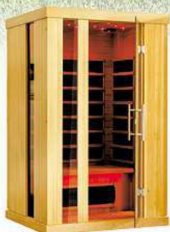
Infrasauna Marimex ELEGANT 1002 L