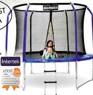
Trampolína Marimex 305 cm schůdky a vnitřní ochranná síť ZDARMA