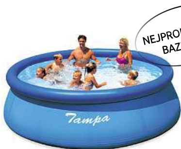
Bazén TAMPA 3,66 x 0,91 m bez filtrace