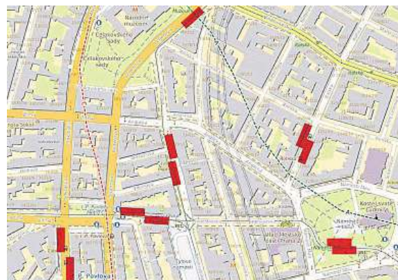
U stanice metra I. P. Pavlova a jeho okolí