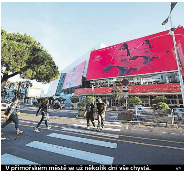
V přímořském městě se už několik dní vše chystá.

Projekcí nového filmu francouzského režiséra Arnauda Desplechina Ismaelovi duchové začne dnes jubilejní 70. ročník mezinárodního filmového festivalu v Cannes. Do hlavní soutěžní sekce letos bylo vybráno 18 snímků. Role předsedy poroty hlavní sekce se ujme španělský filmař Pedro Almodóvar, který sám místní ocenění Zlatá palma nedostal. Spolu s ním v devítileté porotě zasedne mimo jiné americký herec Will Smith, režisér Pak Čchan-wuk z Jižní Koreje, jenž na sebe loni upoutal pozornost filmem Komorná, a také jeho italský kolega Paolo Sorrentino, autor Velké nádhery či Mládí. Zahajovací ceremonii bude moderovat italská herečka Monica Bellucciová.