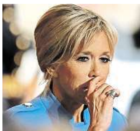
Při projevu svého manžela

Od začátku prezidentské kampaně byla Brigitte Macronová obětí ponižujících poznámek ohledně svého věku.