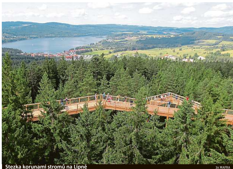
Stezka korunami stromů na Lipně

Starověký Babylon bylo město v jižní Mezopotámii. Jeho název je odvozen z akkadštiny – Bab-ilu neboli Brána boží. Český Babylon je obec u Domažlic. Jak získal název, není ale zcela jasné. Jedni tvrdí, že je to podle nedaleké Babí hory, kde byl i lom. Vždyť v 18. století byla obec v tereziánském katastru zapsána jako Babilon. Jiné zdroje zase uvádějí, že název vyplynul z etnografické různorodosti obyvatel ve vznikajícím letovisku v okolí Horního Pařezovského rybníka. Mímo chodem, v něm se můžete v létě vykoupat. A pokud pak zatoužíte po vyhlídce z bájně Babylonské věže, máme pro vás dvě české alternativy. Z přírodního koupaliště je to na rozhlednu Kurzova věž sotva deset kilometrů. Navíc cesta vede malebným Českým lesem. Ještě o fous blíže je to z Babylonu k Domažlické věži. Ta má jednu zvláštnost. Kvůli nestabilnímu podloží je o 59 centimetrů vychýlená.