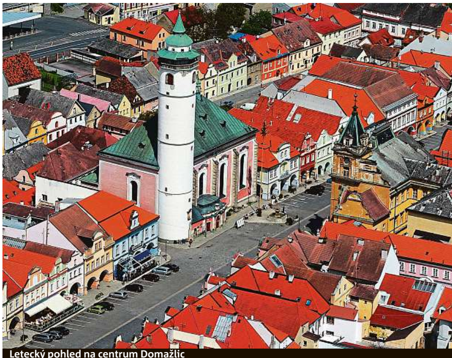
Letecký pohled na centrum Domažlic

Krásné lesy, v nich severoamerické borovice a v oboře se pase lesní zvěř. Jsme v Americe! Jen ti sudokopytníci nejsou sobi, ale daňci a mufloni. A tahle Amerika není za oceánem, ale u Písku. Proč právě tento název? Původně tu byly pastviny. V polovině 19. století však písečtí radní chtěli zabránit vlně vystěhovalců za prací do Ameriky a zdejší půdu rozdělili zdarma mezi nejchudší obyvatele. Takže jim vlastně malý kus vysněné země udělali hned za městem. V současnosti je tu les plný dřevin