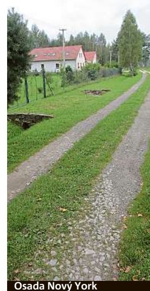
Osada Nový York