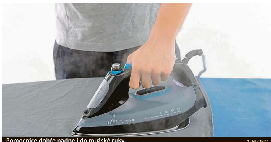
Pomocnice dobře padne i do mužské ruky.

A co že je na ní tak úžasného? Tak si to pojďme vzít pěkně po pořádku. Jako první vlastnost stojí za zmínku automatické nastavení teploty. Už se nemusíte starat o to, abyste své oblečení nespálili. Zároveň bude teplota vždy dostatečná na to, aby žehlička