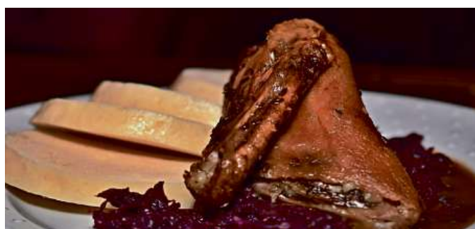
Čtvrťka pečené kačeny se zelím 160 Kč / za 2 porce

Rozšířili jsme nabídku e-shopu o teplá jídla určená k okamžité spotřebě, rozvážená v menu boxech.