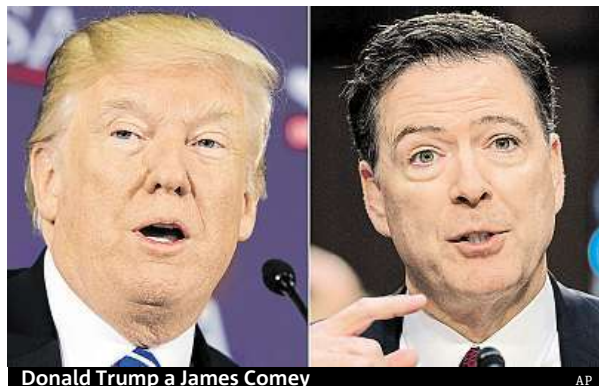
Donald Trump a James Comey

Ještě před začátkem pořadu Trump na Twitteru Comeyho tvrdě kritizoval, označil ho za lháře, slizáka. „Slizoun James Comey, co vždycky skončí špatně a bez práce