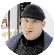
Tlustý Rudolf Nikdy, jsem maximálně loajální.