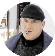
Tlustý Rudolf Nikdy, jsem maximálně loajální.