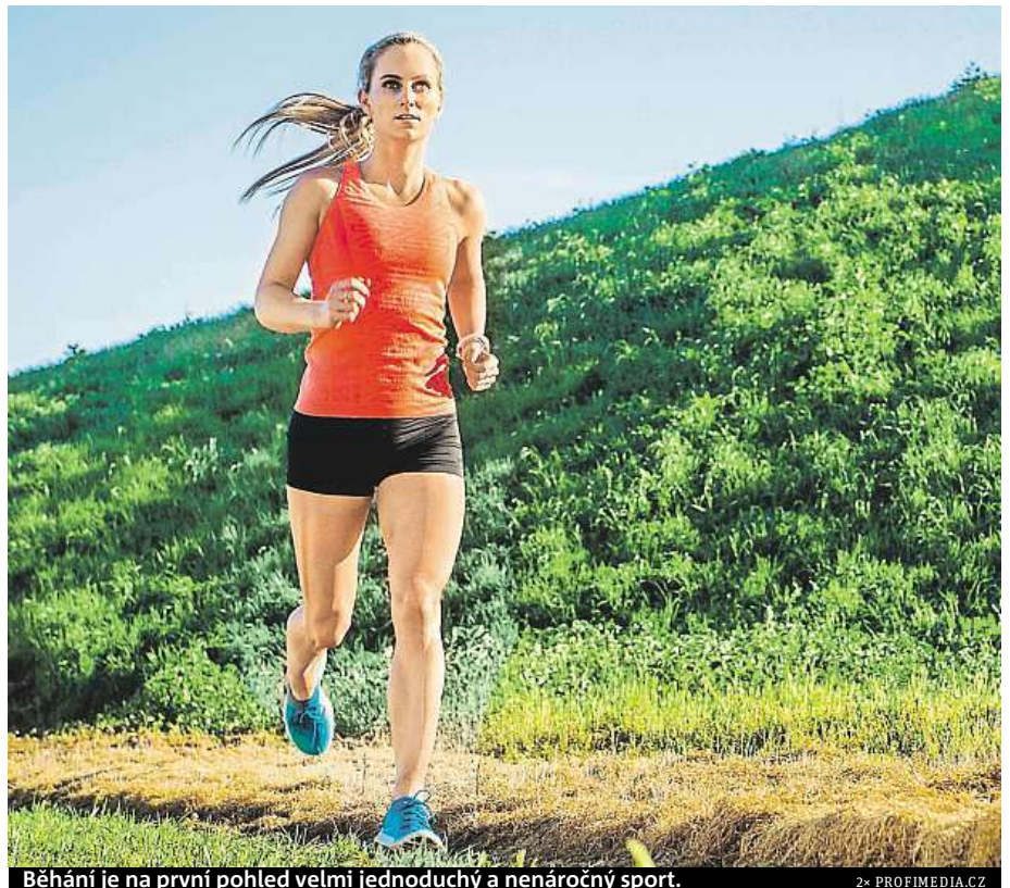
Běhání je na první pohled velmi jednoduchý a nenáročný sport.

Někdo má nestabilní kotníky, jiný vbočené palce. Každá sebemenší jinakost nohy negativně ovlivňuje běh a sériově vyráběné boty s tím mohou něco udělat jen velmi těžko. Řada firem tak dělá boty na míru. Například v Salomonu se specializují především na tvar svršku a výběr mezopodešve a podešve z předem připravených šablon. Adidas zase spoléhá na technologii 3D tisku, která vám přímo na místě dokáže zajistit unikátní tlumící vrstvu přesně podle otisku vašich chodidel. Brooks zase plánuje používat standardní svršek, který se spojí se speciálně vyrobenou tlumící vrstvou z klasické pěny TPU. Tato vrstva bude vyrobena na míru podle toho, ja-