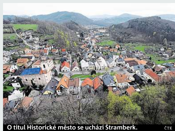
O titul Historické město se uchází Stramberk.