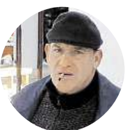
Tlustý Rudolf Nikdy, jsem maximálně loajální.