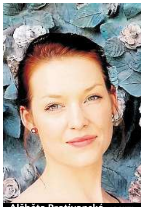
Alžběta Protivanská ARCHIV

Na jedné straně je pravdou, že se psychické problémy stávají čím dál častější překážkou spokojeného života. Na druhé straně nesmíme zapomínat i na fakt, že se jedná o okruh problémů, o kterém se začalo celkově více mluvit. Lidé začali deprese, úzkost nebo psychosomatiku vnímat podobně jako chřipku nebo rakovinu. Něco, co má svoje příčiny, průběh a možná řešení. A hlavně to může ve stejné míře připravit člověka o radost ze života, zdraví i schopnost se vyrovná-