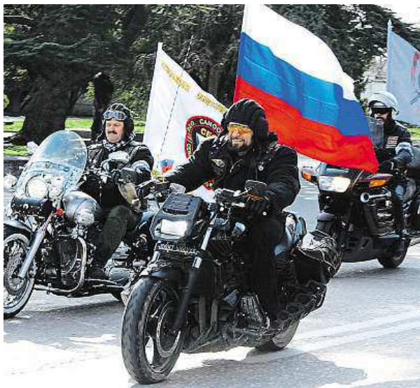
Ruští Noční vlci

Podle německé policie zatím nepřišla žádost motorkářů o povolení průjezdu německou metropolí. Pokud ale v příštích dnech bude podána, bude co nejrychleji zamítnuta, zjistil německý deník Die Welt. Tito lidé Berlínem rozhodně neprojedou jako konvoj, řekl listu jeho zdroj.