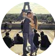
Lukáš Auguštin V Sapě mají čokoládu Ritter Sport, co chutná úplně jinak.

Setkali jste se už s padělanými značkami potravin?