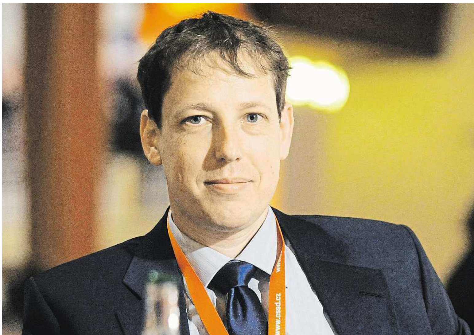
Stanislav Gross na snímku z roku 2009, kdy už stál mimo vrcholnou politiku a měl složený advokátské zkoušky.

Choroba. Ve 45 letech zemřel na nemoc, jež napadá nervové buňky. Politická kariéra. Ve 34 letech se stal nejmladším premiérem, po kauze s bytem záhy rezignoval. Kál se. Loni se omluvil všem, jež zklamal STRANA 2