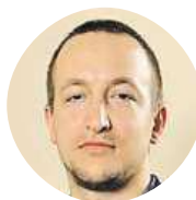
Vladimír Šotouš Svoboda Mozartovy koule, originál stojí tak 4,5 eura.

Komiks Divadlo Spejbla a Hurvínka najdete na www.facebook.com/DivadloSH