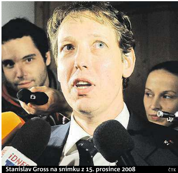
Stanislav Gross na snímku z 15. prosince 2008