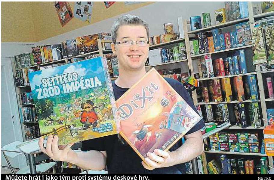
Můžete hrát i jako tým proti systému deskové hry.

Stojí mezi stovkami různých krabic v pražském prodejním centru Ráj deskovek, kde je ve svém živlu. Obsah