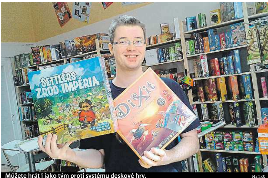
Můžete hrát i jako tým proti systému deskové hry.

Stojí mezi stovkami různých krabic v pražském prodejním centru Ráj deskovek, kde je ve svém živlu. Obsah