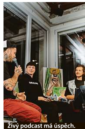
Živý podcast má úspěch.

kteřá doslova kolaboraci přináší. Zmiňuji nebojácnost i z toho důvodu, že ne všechny projekty vám spadnou do klína, a občas je nutné, abyste první krok udělal vy. Sice o sobě tvrdím, že rozhodně nejsem ekonom, ale byznysový duch je nedílnou součástí, kterou nezapřu. Na světě je přes osm miliard talentovaných lidí a každý z nich je skvělý v něčem jiném, nebojte se o sobě dát vědět. Konkurence je velká a dosáhnout podobných projektů může úplně každý. Stačí mít sny, zdokonalovat se a jít si za těmi nejdílenějšími. A snažit se dělat to, co vás naplňuje.