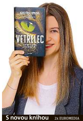
S novou knihou 2x EUROMEDIA