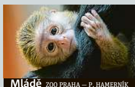
Mládě ZOO PRAHA – P. HAMERNÍK

V Zoo Praha se narodil kočkodan Brazzův, návštěvníci ho mohou vidět v pavilonu Rezervace Dja. Mládě se narodilo devítileté samici Anastasii. ČTK