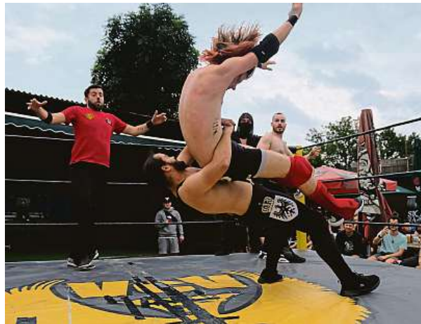
2x ARCHIV VCV WRESTLING

mají nějaké zdravotní problémy, které by utrhli během souboje.