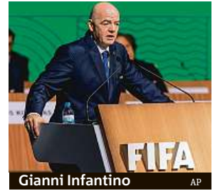
Gianni Infantino

Mezinárodní fotbalová federace má staronového šéfa.