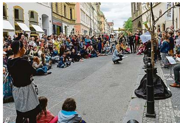
Část Vodičkovy ulice bude pro auta neprůjezdná. PETRA HAJSKÁ

Jednotlivé koncerty a představení jsou rozděleny dle věkových kategorií. Kompletní program najdete na webu www.strunydetem.cz . MET