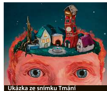
Ukázka ze snímku Tmání