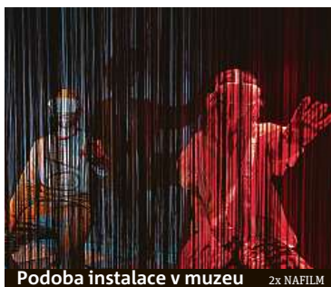
Podoba instalace v muzeu 2x NAFILM