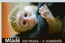
Mládě ZOO PRAHA – P. HAMERNÍK

V Zoo Praha se narodil kočkodan Brazzův, návštěvníci ho mohou vidět v pavilonu Rezervace Dja. Mládě se narodilo devítileté samici Anastasii. ČTK