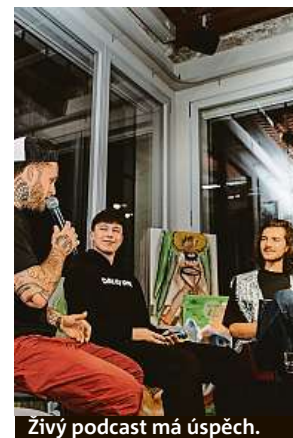
Živý podcast má úspěch.

kteřá doslova kolaboraci přináší. Zmiňuji nebojácnost i z toho důvodu, že ne všechny projekty vám spadnou do klína, a občas je nutné, abyste první krok udělal vy. Sice o sobě tvrdím, že rozhodně nejsem ekonom, ale byznysový duch je nedílnou součástí, kterou nezapřu. Na světě je přes osm miliard talentovaných lidí a každý z nich je skvělý v něčem jiném, nebojte se o sobě dát vědět. Konkurence je velká a dosáhnout podobných projektů může úplně každý. Stačí mít sny, zdokonalovat se a jít si za těmi nejdílenějšími. A snažit se dělat to, co vás naplňuje.