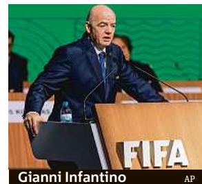
Gianni Infantino

Mezinárodní fotbalová federace má staronového šéfa.