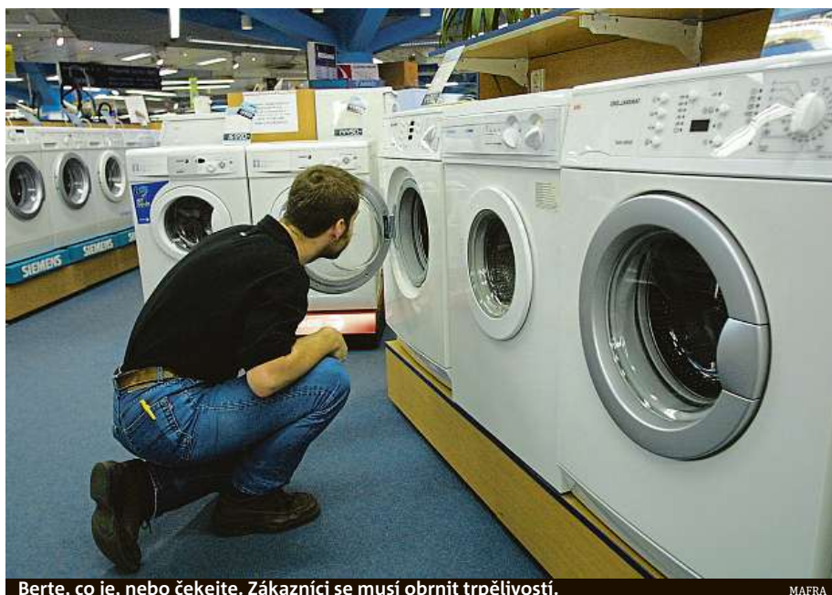
Berte, co je, nebo čekejte. Zákazníci se musí obrnit trpělivostí.