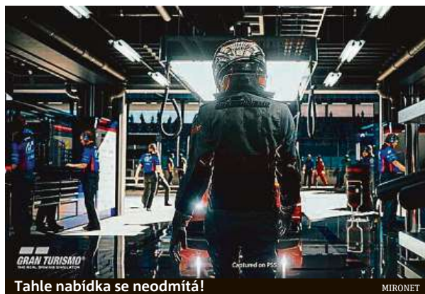
Tahle nabídka se neodmítá!

Pořiď si nejnovější závodní simulátor v internetovém obchodu Mironet.cz za 3590 korun. MET