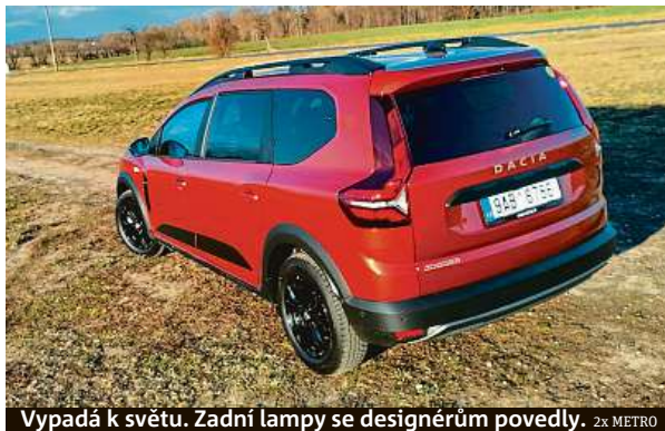
Vypadá k světu. Zadní lampy se designérům povedly.

bavách modelu. Nad tímto pásem se nacházejí důležité prvky pro řidiče – přístrojový štít, multimediální obrazovka – a pod ním, stále na dosah ruky, tlačítka ovládání klimatizace a jízdních asistentů. Textilní potah se nachází i na středové loketní opěrce a loketních opěrkách předních dveří.