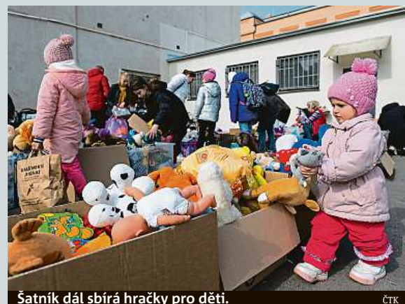
Šatník dál sbírá hračky pro děti.