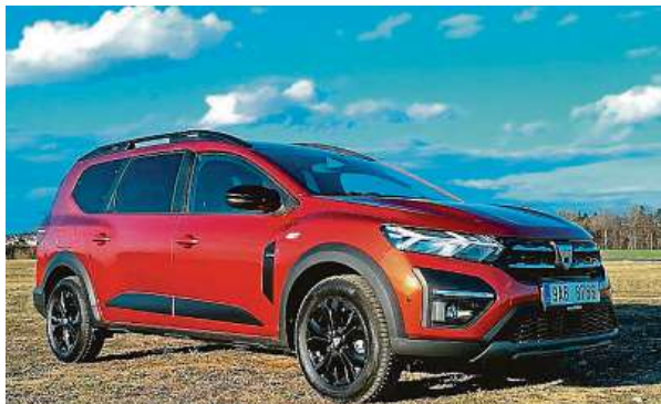
Z Joggeru se stane cenový trháč. Proč ne, je to dobré auto.

Dojem z interiéru je také pozitivní. Plastové výplně dveří by sice zasloužily ještě nějakou péči, ale hezká je například šedá tkanina lemuující palubní desku ve vyšších vý-