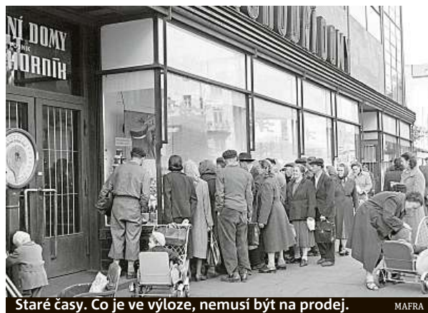
Staré časy. Co je ve výloze, nemusí být na prodej.