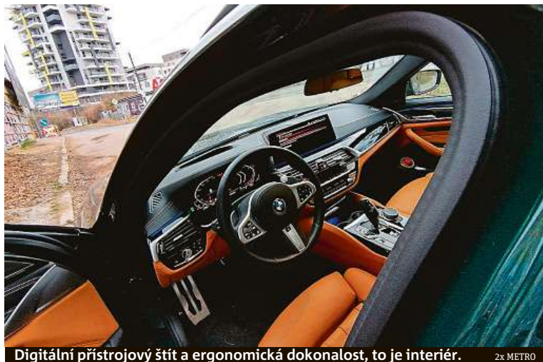
Digitální přístrojový štít a ergonomická dokonalost, to je interiér. 2x METRO

Ani to však neodradilo Policii České republiky, aby objednala hned sedmdesát těchto stíhaček do vozového parku. Kdepak škodovky! Čtyřicet exemplářů BMW 540i xDrive Touring bude v policejním zbarvení hlídat české řidiče, dalších třicet bude v civilním provedení.