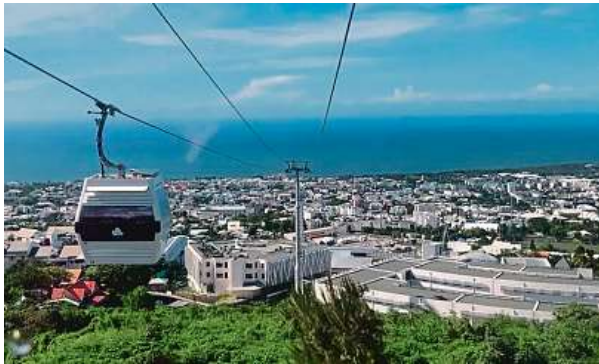
Réunion leží 500 kilometrů východně od Madagaskaru. HOARAU

Horkou novinku v Indickém oceánu má na svědomí výrobce lyžařských vleků.