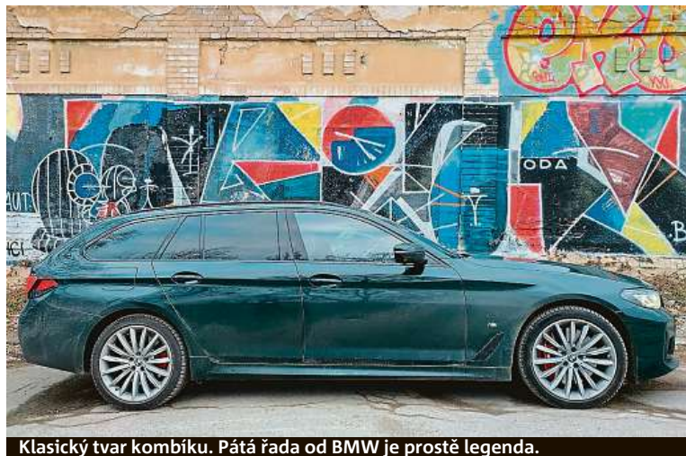
Klasický tvar kombíku. Pátá řada od BMW je prostě legenda.

Takhle dobře vyladěné auto jsme v testu dlouho neměli. BMW 540i v kombíku je ideál nad ideály.