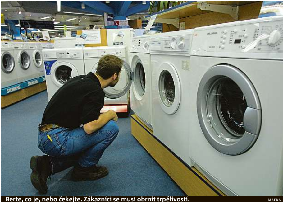
Berte, co je, nebo čekejte. Zákazníci se musí obrnit trpělivostí.