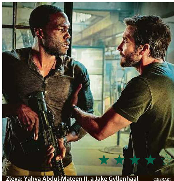
Zleva: Yahya Abdul-Mateen II. a Jake Gyllenhaal

Jedinou únikovou cestu představuje právě sanitka, která přijela pro těžce zraněného policistu. Will a Danny ji unesou, společně s postřeleným mužem a záchranářkou Cam Thompsonovou (Eiza Gonzálezová), která i v neleh-