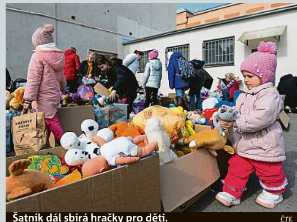
Šatník dál sbírá hračky pro děti.