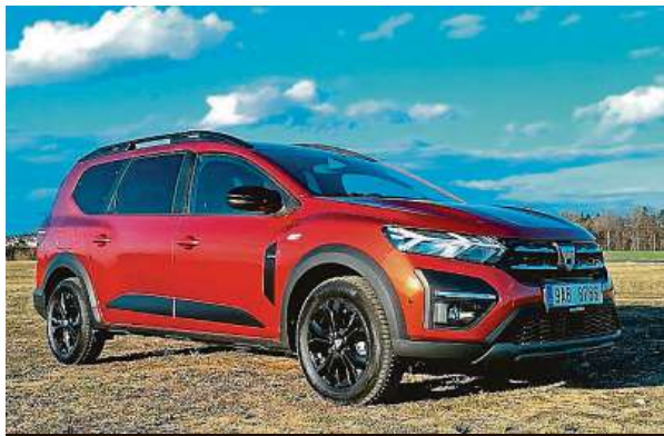
Z Joggeru se stane cenový trháč. Proč ne, je to dobré auto.

Dojem z interiéru je také pozitivní. Plastové výplně dveří by sice zasloužily ještě nějakou péči, ale hezká je například šedá tkanina lemuující palubní desku ve vyšších vý-