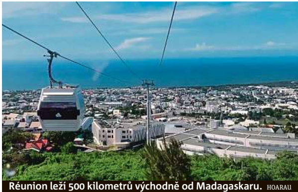
Réunion leží 500 kilometrů východně od Madagaskaru. HOARAU

Horkou novinku v Indickém oceánu má na svědomí výrobce lyžařských vleků.