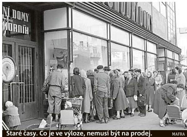
Staré časy. Co je ve výloze, nemusí být na prodej.