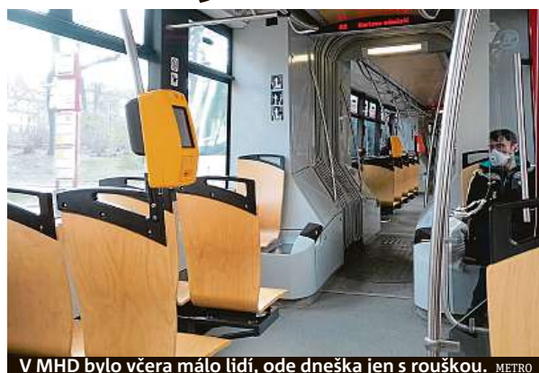
V MHD bylo včera málo lidí, ode dneška jen s rouškou. METRO

V Česku je akutní nedostatek roušek a respirátorů, které chybí i ve zdravotnictví. Praha objedná 233 tisíc respirátorů za 35 milionů korun. Dorazit mají zítra. Dopravní podnik rozmístil do vestibulu