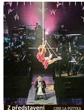
Z představení CIRK LA PUTYKA