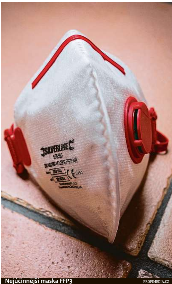
Nejúčinnější maska FFP3

Myjte si ruce a osobě, o kterou pečujete (například malé dítě), při mytí rukou pomáhejte. To by se mělo provádět často a důkladně mýdlem