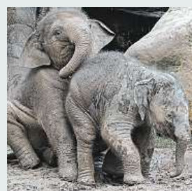
Včerejší hrátky ZOO PRAHA