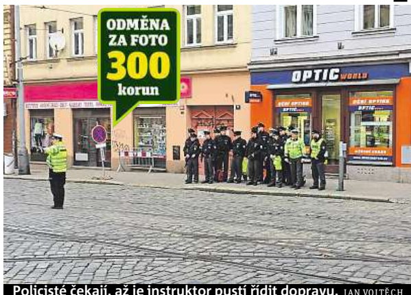
Policisté čekají, až je instruktor pustí řídit dopravu. JAN VOJTECH

Pískání policejních píšťalek patří v posledních dnech k nuselským křižovatkám. Mladí policisté vykonávají řízenou praxi přímo v ulicích Prahy 4. Na vybraných dvou křižovatkách – Táborské s Nuselskou a ulicích Lounských – si osvojují základní pokyny v rámci řízení provozu, učí se orientaci v křižovatce a seznamují se s ručním ovládním semaforu. „Praktická část výuky probíhá pod dozorem zkušených policistů z oddělení řízení dopravy krajského ředitelství,“ popisuje policejní mluvčí Andrea Zoulová.