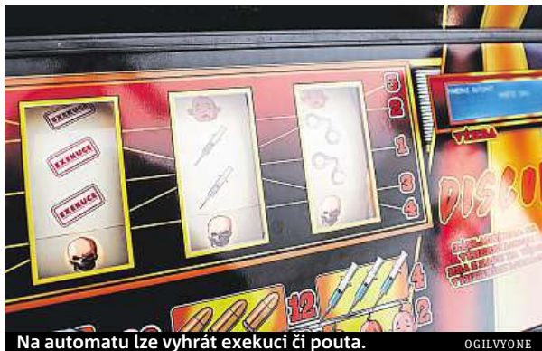
Na automatu lze vyhrát exekuci či pouta.

Automat hráče ožebračil a v momentě, kdy hráčova frustrace vyvrcholila, mu všechny peníze vrátil spolu s informací o nově otevřeném Drop In centru v Praze 12, kde může vyhledat odbornou pomoc. Automat do herny umístilo centrum ve spolupráci s agenturou OgilvyOne. „Bylo zajímavé sledovat reakce hráčů, z nichž někteří s au-