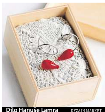
Dílo Hanuše Lamra DYZAJN MARKET

Dyzajn market jaro se bude 18. a 19. března poprvé konat nejen na náměstí Václava Havla, ale také v sousední Provozní budově Národního divadla. V jejím přízemí budou umístěni ti designéři, kteří jsou u nás považováni za nejlepší. Sekci pořadatelé nazvali „Topdyzajn“. Čtyři z patnácti zde vystavujících designerů jsou nominováni na Czech Grand Design – grafické studio Take Take Take, šperkař Hanuš Lamr, šperkařka Eliška Lhotská a designérská skupina Lípa. Celkem se na akci, na kterou je vstup zdarma, představí přes 200 designérů. Nebudou chybět koncerty, workshopy, divadlo ani autorská čtení. PUR