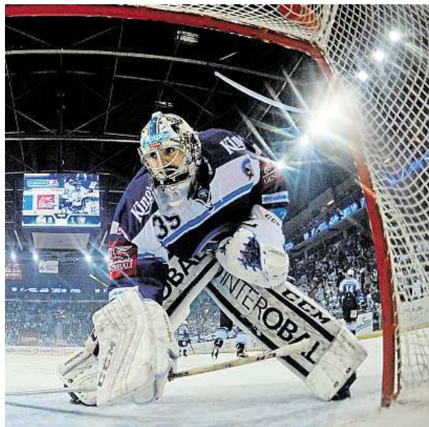
Brankář Plzně Matěj Makovský na ledě Liberce

Obhájce titulu Liberec naopak potvrdil dobrý střední vstup do play-off. Bílí Tygři porazili Plzeň i podruhé dvoubrankovým rozdílem, tentokrát 4:2. ŠIM