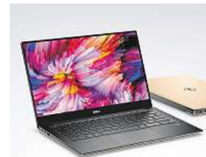
Notebook DELL XPS 13

na tři roky a u mnoha modelů i na dárky v hodnotě přes 3,5 tisíce korun, pořídíte-li DELL XPS 13 v internetovém obchodě Mironet.