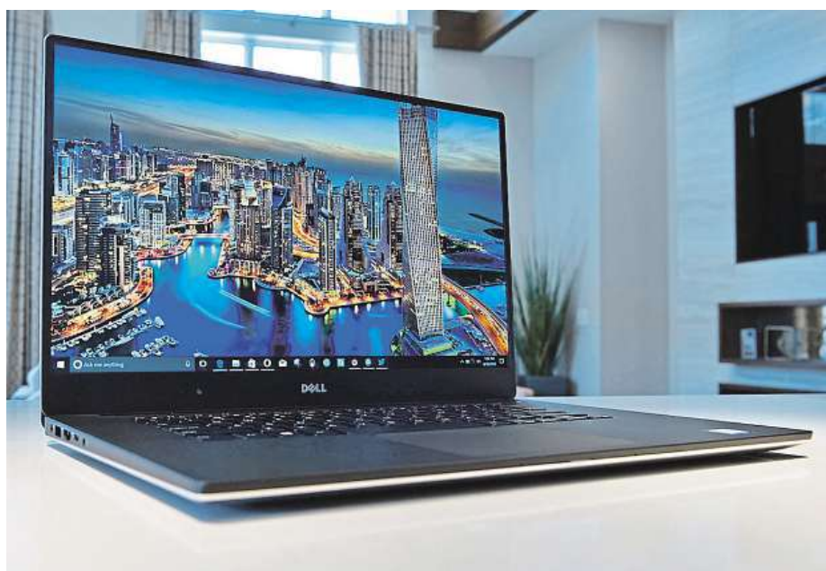
DELL XPS 15 (9560) vás potěší po všech stránkách.

V závislosti na konkrétním modelu se pak můžete opřít až o 16 GB operační paměti a data svěřit až 1TB SSD disku. Pro mnohé uživatele je nepostradatelnou součástí výbavy tříletý Next Business Day servis, který vám zajistí případný servisní zásah do druhého pracovního dne, a to kdekoli po celém Česku.