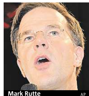
Mark Rutte

Před pár dny se dokázal vzepřít Turecku, teď slaví vítězství v domácích volbách.