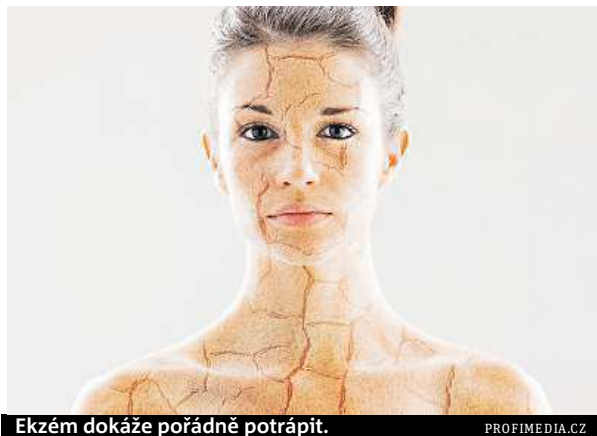
Ekzém dokáže pořádně potrápít.

Ekzém nejčastěji postihuje nejmenší děti, po pátém nebo patnáctém roku života pak většinou samovolně vymizí. Objevují se ale i případy, kdy se první příznaky objeví až později a přetrvávají.