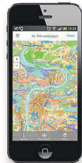
Seznamte se s plánem. IPR

Aplikace poslouží především projektantům, realit-