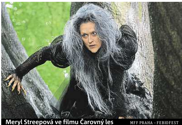
Meryl Streepová ve filmu Čarovný les

Již na slavnostním zahájení převezmou sošku Kristiána za přínos světové kinematografii americká herečka Kim Novaková, oscarový režisér Jean-Jacques Annaud a britský herec Alan Rickman. Rickman, známý jako profesor Snape z Harryho Pottera, uvede svůj nový film