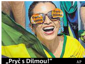
„Pryč s Dilmou!“

Ekonomický boom zažila Brazílie během vlády předchůdce Rousseffové, prezidenta Luíze da Silvy, tedy v době,