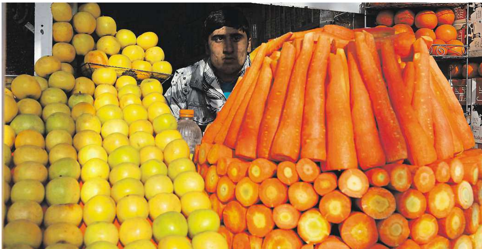
Marketplace in Kabul. Five thousand years ago, carrots only grew in Afghanistan and most were purple.