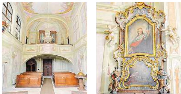
Fasáda čeká na opravu, ale kaple už září novotou. PRAHA 8