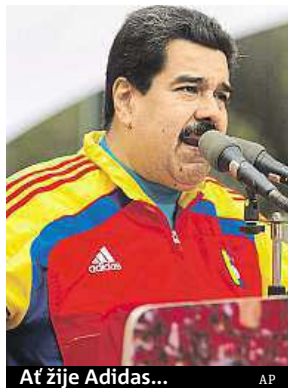
Ať žije Adidas...

Takzvaný „proti-imperialistický“ zákon poskytne venezuelskému prezidentovi takřka neomezenou moc.