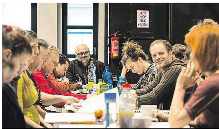
Herci už zkouší hru Spolupracovníci, kterou opravené divadlo otevřou. L. SKOKAN

Začala oprava libeňského Divadla pod Palmovkou. To včera začalo předávat svou scénu stavební firmě, která jí bude rekonstruovat. Práce na opravách divadla mají skončit v létě.