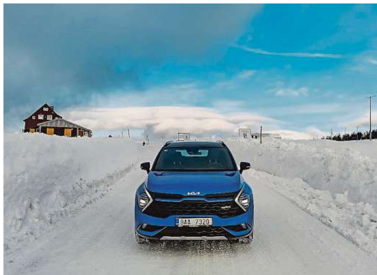
Na autě je už nové logo Kia, představené v lednu.