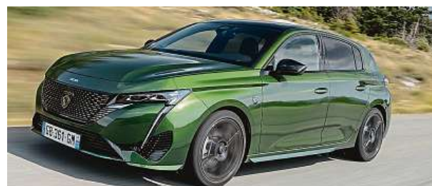
Peugeot 308 je v Česku ke koupi od ledna.

Celkového vítěze oznámí porota 8. března 2022 na Mezinárodní den žen. HOP