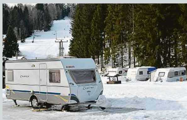
O ubytování v karavanech je velký zájem.

Tento způsob trávení dovolené zažívá v Česku velký boom. Počet karavanů se výrazně zvyšuje. „Češi jsou raději vlastníci, ale je tu velké množství půjčoven,“