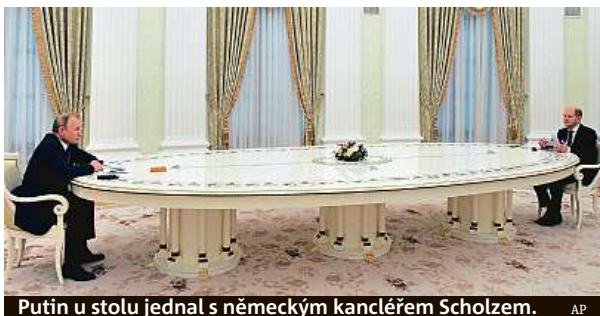
Putin u stolu jednal s německým kancléřem Scholzem.