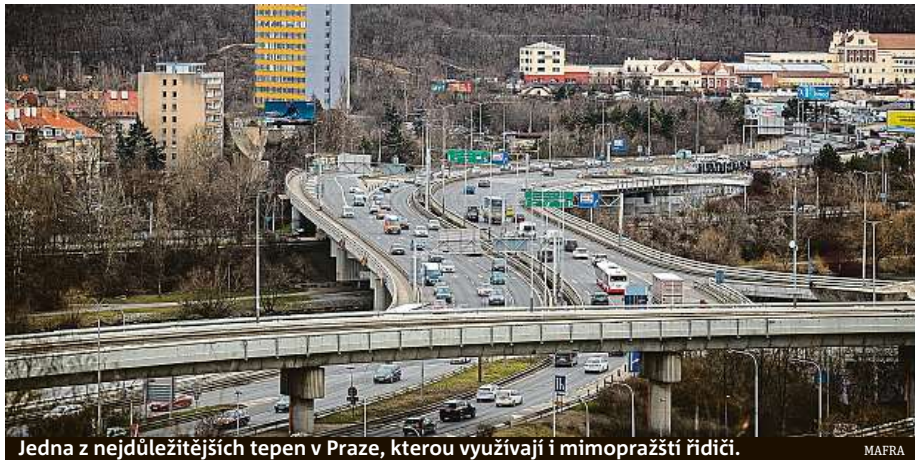
Jedna z nejdůležitějších tepen v Praze, kterou využívají i mimopražští řidiči.

Od letoška po čtyři stavební sezony budou dělníci pracovat na vrchní části, což s sebou každý rok přinese omezení. Letošní opravy začnou snížením a vybudováním nové rampy ze Strakonické ulice (více v boxu).