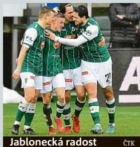
Jablonecká radost

Fotbalisté Jablonce rozdrtili v dohrávce čtvrtfinále domácího poháru MOL Cupu Mladou Boleslav 4:0 a stali se posledním semifinálistou soutěže. V boji o finále nastoupí na Spartě. Za domácí se dvakrát trefil Malínský, po jedné brance přidali Považanec a Silný.