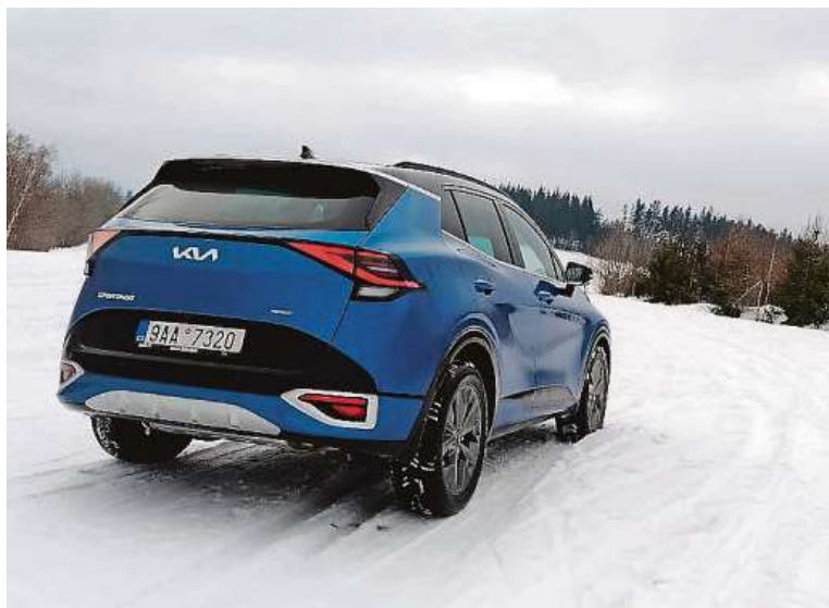
Novinkou je zbrusu nový systém Terrain Mode s voličem jízdních režimů.