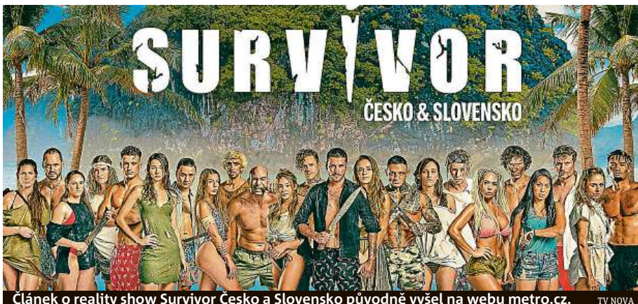
Článek o reality show Survivor Česko a Slovensko původně vyšel na webu metro.cz. TV NOVA

Původní reality show Survivor, která je u nás známá především jako Kdo přežije, má asi milion řad a v Česku a na Slovensku snad ještě jednou tolik fanoušků. Teď to můžeme pochopitelně v nadsázce. Víme ale s jistotou, kolik lidí současné prznění Survivoru na obrazovkách Novy a Markí-