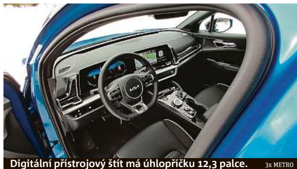
Digitální přístrojový štít má úhlopříčku 12,3 palce.

Ostatně je dost zajímavé i zevnitř. Model vyráběný v továrně v Žilině zaujme nejen zakřiveným displejem ovládaným, panoramatickou prosklenou střešou nebo docela velkým kufrem, ale zejména technikou. Vyzkoušeli jsme benzinový hybrid HEV kombinující přeplňovaný řadový čtyřválec s obsahem 1,6 litru a elektromotor poháněný vysokonapětovým akumulátorem. Auto opět jako u pohonu všech kol přepíná podle jízdních podmínek mezi motorem a elektromotorem, případně pracují společně. Dobíjení baterie o kapacitě