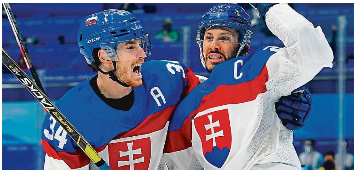
Slovenští hokejisté zdolali USA po nájezdech a po 12 letech si zahrají olympijské semifinále. Novinky z Pekingu na straně 12

Praktičtí lékaři. V zápase s pandemií byli dlouho opomíjeni, válcovala je očkovací centra. Vakcinace. Mají významný podíl především na očkování seniorů. Trápení. Doktorskou práci komplikuje papírování STRANA 5