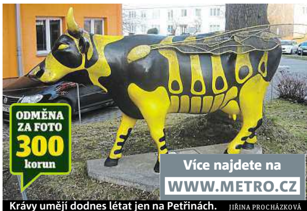
Krávy umějí dodnes létat jen na Petřínách. JIŘINA PROCHÁZKOVÁ

Sochy krav měly ve své době obrovský ohlas a po vzoru New Yorku, Tokia či Bruselu se na některých místech republiky zachovaly dodnes.