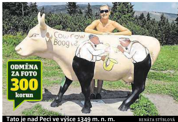
Tato je nad Pecí ve výšce 1349 m. n. m. RENÁTA STYBLOVÁ