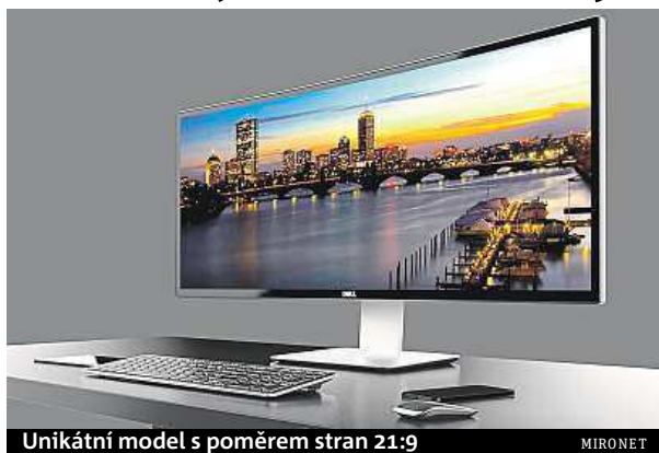
Unikátní model s poměrem stran 21:9

Samozřejmostí je široká paleta konektorů od USB, přes HDMI, až po DisplayPort. Jako příjemný bonus pak skvělá next business day záruka, jež zajišťuje servis do druhého pracovního dne přímo u vás doma.