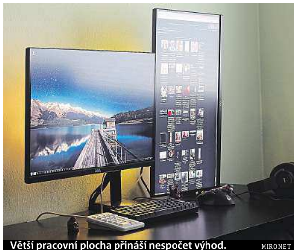
Větší pracovní plocha přináší nespočet výhod.

Tím je zaručen perfektní obraz, ať už se budete dívat odkudkoli. Grafici, ale i běžní uživatelé ocení mimořádně realistické barvy, jelikož je monitor už z výroby nakalibrován tak, aby pokryl 99 % barevného prostoru RGB. Nikoho pak patrně nepřekvapí mimořádně bohatá konektivita, kterou zajišťují porty HDMI, DisplayPort a mini Display-