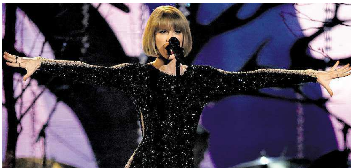
Album americké zpěvačky Taylor Swiftové nazvané 1989 získalo hudební cenu Grammy za nejlepší album roku. Více strana 8

Charitativní projekt CowParade. Před dvanácti lety zaplnil metropoli pestrobarevnými kravami. Rohaté sochy. Z Prahy se časem odstěhovaly do všech koutů Česka. Čtenáři Metra. Poslali jste přes 30 fotek STRANA 4