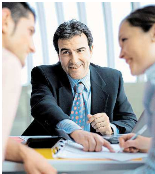
Při výběru půjčky buďte ostražití.