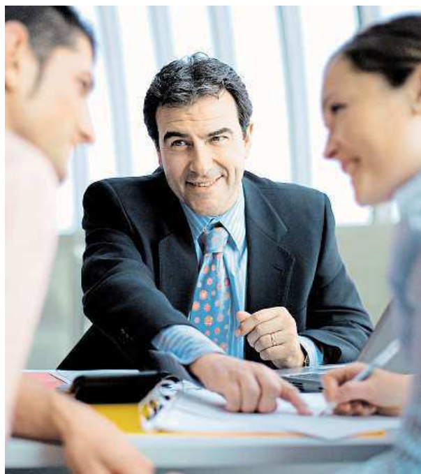
Při výběru půjčky buďte ostražití.

U nebankovních subjektů, kterých v současnosti na trhu působí přes 50 tisíc, je tomu však v řadě případů jinak. „Tam se registry tolik neřeší, a nemusí se tak některé závazky klienta odhalit. Peníze si tak půjčí i lidé, kteří pak mají se splácením problémy,“ vysvětluje Drásalová. Navíc mnohdy požadují i za malou půjčku zaručení hmotným majetkem, třeba bytem či autem. DANA JAKEŠOVÁ