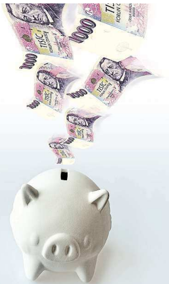
Splacení půjčky má plno pravidel.

budou moci splatit úvěr na bydlení zdarma v případě zásadních životních situací. Půjde o případy úmrtí, dlouhodobé nemoci či invalidity dlužníka, jeho manžela nebo partnera, které by vedly ke snížení schopnosti splácet spotřebitelský úvěr na bydlení. ELIŠKA ZIKMUNDOVÁ