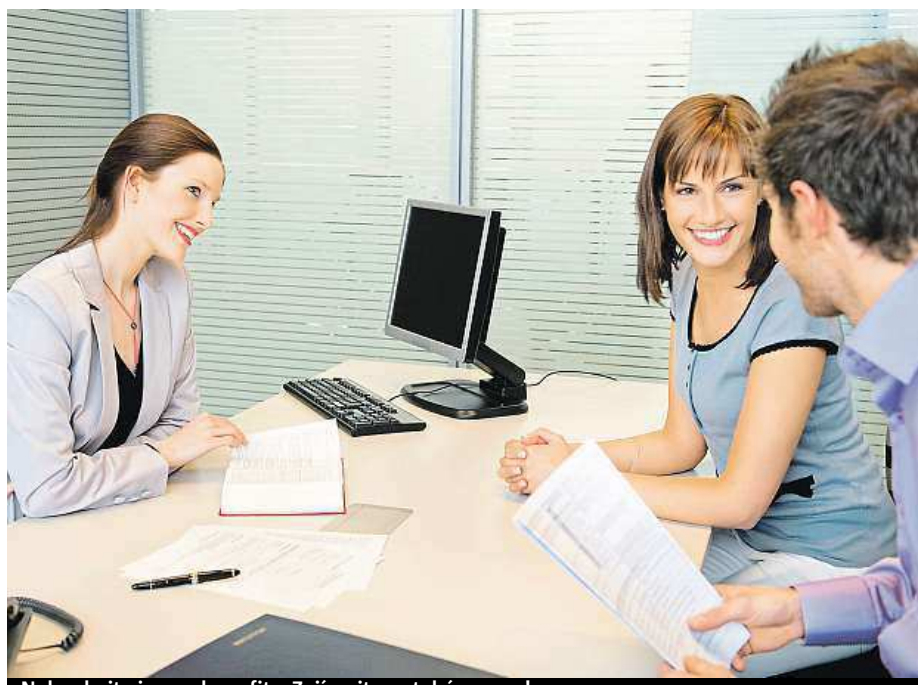
Nekoukejte jen na benefity. Zajímejte se také o cenu!