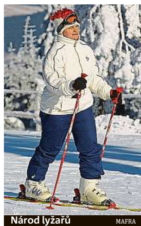
Národ lyžařů MAERA