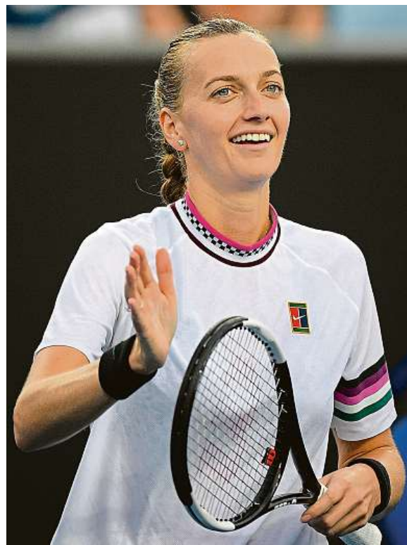
Ve třetím kole byla v Austrálii naposledy v roce 2015.

Naopak skončila Markéta Vondroušová, která podlehla 4:6 a 5:7 Chorvatce Petře Martičové. SM