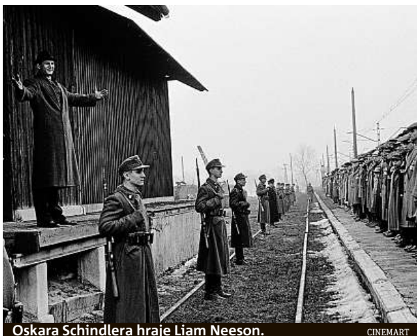
Oskara Schindlera hraje Liam Neeson.

Český distributor, CinemaArt, spojil znovu uvedení Schindlerova seznamu s Mezinárodním dnem obětí holocaustu, který připadá na 27. ledna. Většina multikin a zhruba osmdesátka jednosálkových kin, jež tuto speciální