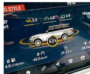
Zásuvka pro dobíjení je v přední masce, plně nabitě auto ujede čistě na elektřinu 49 kilometrů. Na závěr jízdy vyhodnotí počítač váš jízdni styl.