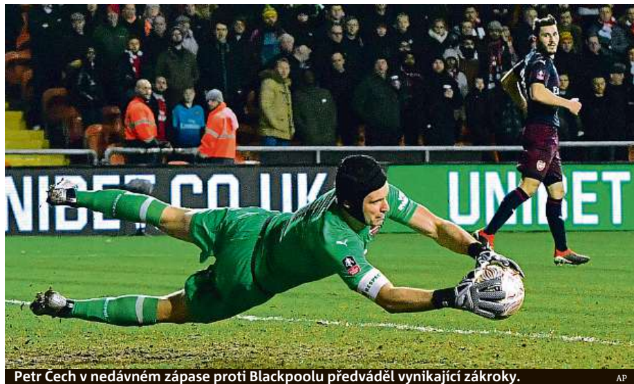
Petr Čech v nedávném zápase proti Blackpoolu předváděl vynikající zákroky.

Čech uvedl, že svou budoucnost bude řešit až po skončení tohoto ročníku. V současnosti je asistentem hlavního kouče londýnské Chelsea Maurizia Sarriho další bývalý gólman Blues a někdejší Čechův spoluhráč, Ital Carlo Cudicini. čtk