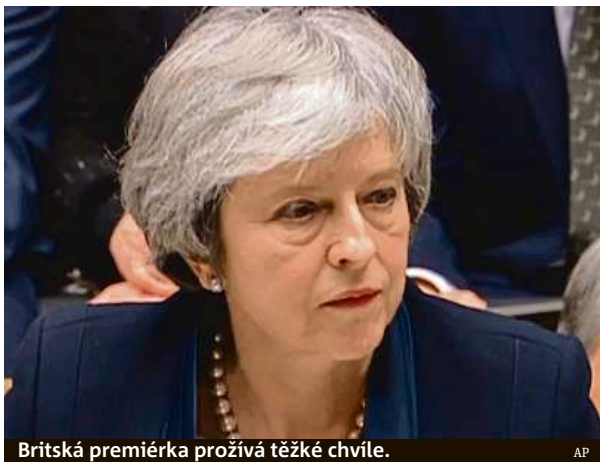
Britská premiérka prožívá těžké chvíle.

„Nechcete-li brexit bez dohody, musíte zajistit, že bude-