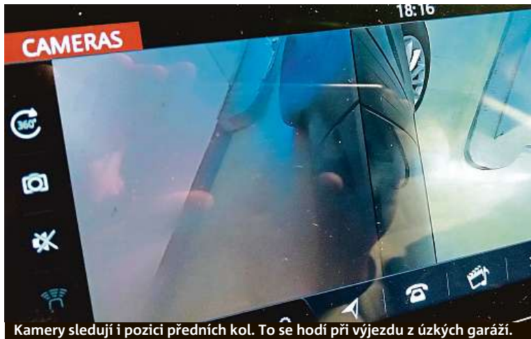
Kamery sledují i pozici předních kol. To se hodí při výjezdu z úzkých garáží.