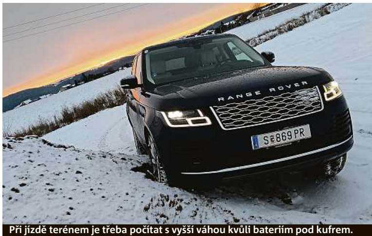
Při jízdě terénem je třeba počítat s vyšší vahou kvůli bateriím pod kufrem.