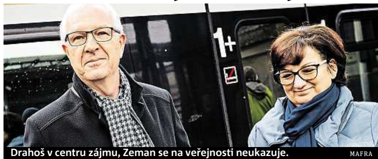
Drahoš v centru zájmu, Zeman se na veřejnosti neukazuje.