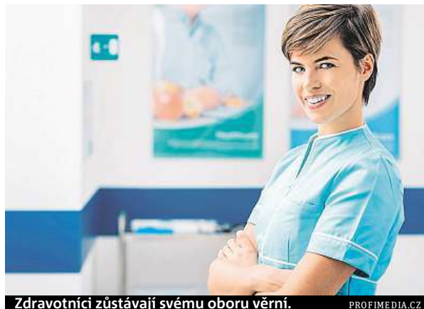
Zdravotníci zůstávají svému oboru věrní.

„Absolventi strojírenských oborů zůstávají nejvěrnější svému oboru nejen v době těsně po ukončení školy, ale i po dobu svého profesního života. Zároveň dlouhodobě vy-