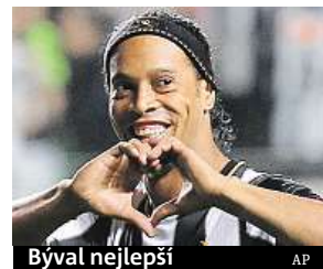
Bývalý nejlepší