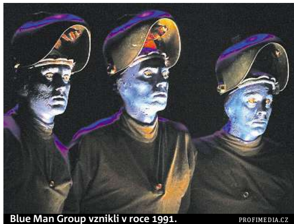
Blue Man Group vznikli v roce 1991.

Blue Man Group oslavili předloni 25. výročí a v červenci loňského roku se pak stali plnohodnotnými členy týmu Cirque du Soleil. Ze skupiny 20 pouličních artistů ve svých počátcích v roce 1984 se Cirque du Soleil stal významnou mezinárodní organizací zajišťující vysoce kvalitní artistická vystoupení. HOPE