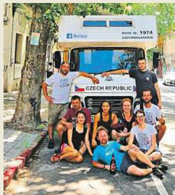
Po týdnu čekání konečně vysvobozujeme Amálku z přístavu v uruguayském Montevideu a můžeme vyrazit na naši jihoamerickou expedici.

Nebojí se rozprodat majetek, postavit nebo upravit si speciální vůz, hodit za hlavu konvence a vyrazit napříč světem – novodobí nomádi. Taky se jim říká digitální, protože díky možnosti připojení odkudkoliv na svých cestách pracují a své zážitky sdělují na blozích a sociálních sítích. Že opravdu jde cestovat jinak než „letadlem do čtyřhvězdičkového hotelu a po týdnu zpět“, poznají ti, kdo dorazí do pavilonu F. Setkají se zde s českými a slovenskými cestovateli, kteří se do širšího povědomí dostali díky seriálu Nomádi zpravodajského serveru Lidovky.cz. „Reprezentují čtyři různé způsoby cestování: Martin Magnusek jezdí sám na motorce, zatímco Vojtěch Wertich cestuje letitou obytnou Avii a vždy kolem sebe vytvoří expediční tým. Projekt Bronco namísto hotela popisuje, jak to dopadne, když se architekt a jeho žena pustí do stavby expedičního speciálu. A nakonec projekt Hugo a my ukazuje, jak je možné skloubit práci na dálku s životem v dodávce v různých koutech Evropy,“ popsal Tomáš Málek, vedoucí webu Lidovky.cz.