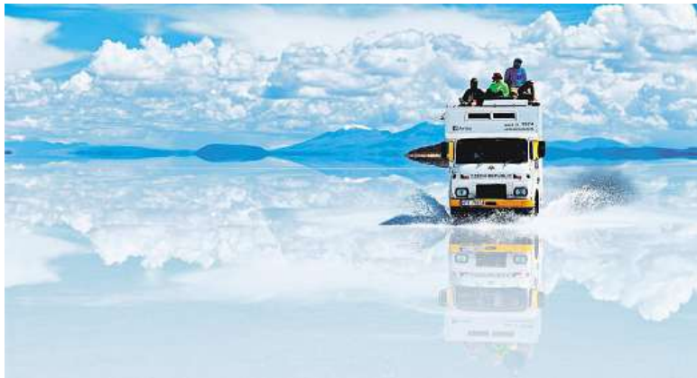
Druhý den na salaru se dostáváme dále na jeho zatopené části. Mraky plující po obloze se stejně jako Amálka odráží v nekonečném zrcadle.

Deset skvělých brněnských restaurací předvede své umění na GO a Regiontour. A zájemci mohou vyhrát jejich degustační menu. Neotálejte a pokuste se o to na Facebooku BVV.