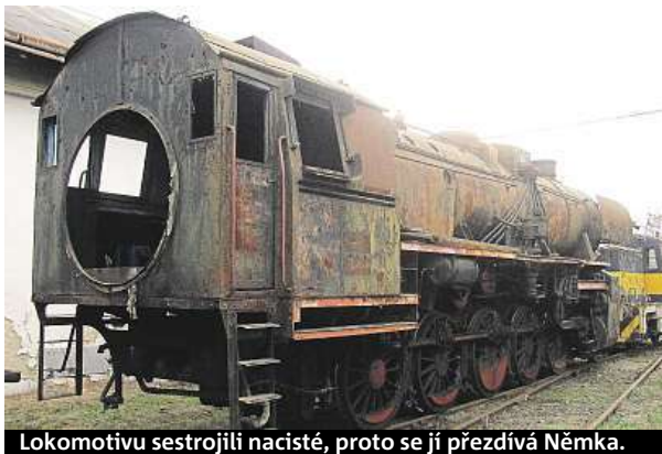
Lokomotivu sestrojili nacisté, proto se jí přezdívá Němka.

Lokomotiva byla vyrobená v nacistickém Německu firmou Henschel za druhé světové války, v Česku se jí proto