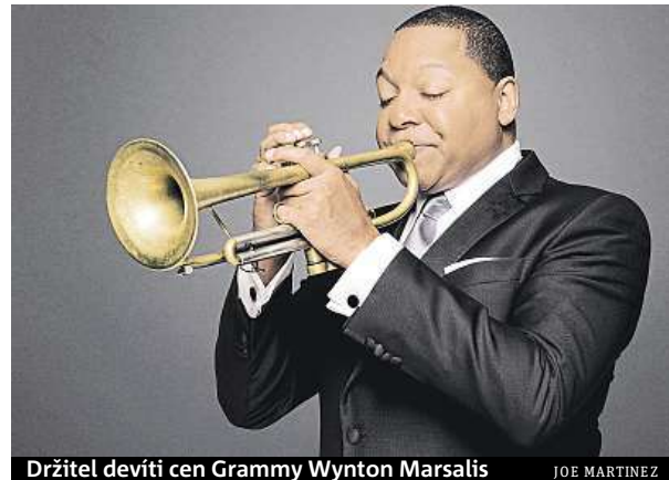
Držitel devíti cen Grammy Wynton Marsalis

Brněnská zoo má po několika ledních medvědích, která se narodila v posledních letech, zaděláno na nový návštěvnický hit. Loni v létě se do zoo po čtrnácti letech vrátili králové zvířat. Lev Lolek a lvice Kivu velmi rychle rozptýlili veškeré nejistoty o tom, jak spolu budou vycházet, a den před Silvestrem zoo ohlásila narození dvou lvičat. Chovatelé však nadšení veřejnosti zatím krotí. Zda odchov proběhne úspěšně, se dozvíme až po několika měsících. „Pokud by Kivu měla mláďata už dříve a věděli bychom, že se o ně umí postarat, kritické období bychom mohli počítat na týdny, jelikož je však prvoročkou, budou to měsíce,“ upozorňuje vedoucí útvaru vnějších