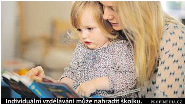
Individuální vzdělávání může nahradit školku.

„Oslovili jsme 96 mateřských škol a z celkového počtu 4000 dětí využilo institu-