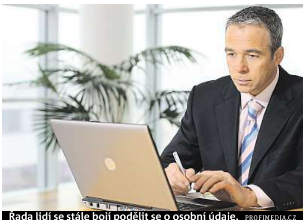
Rada lidí se stále bojí podělit se o osobní údaje.

Zatímco 44 procent z nich je frustrovaných, když jim společnost nedodají relevantní, personalizované nákupní zážitky, téměř polovina má obavy o soukromí a ochranu osobních údajů při přihlašování do inteligentních služeb určených pro po-