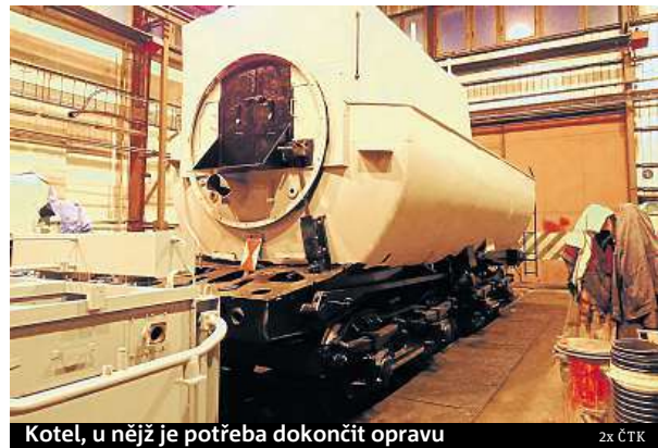
Kotel, u něž je potřeba dokončit opravu

Každý z přispěvatelů se může těšit na odměnu – od