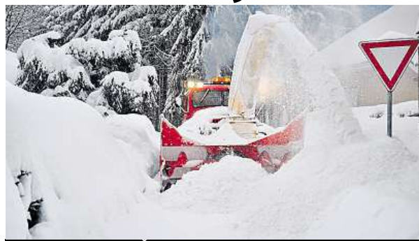
Sněž zasypal sever Česka. Dál by už tolik sněžit nemělo.

Letošní leden je na sněž bohatý. V Jablonci od začátku letošní zimy napadlo 160 centimetrů sněhu, za celou minulou zimu to bylo jen 125 centimetrů. Počasí přilákalo na hory minulý víkend tisíce lyžařů. Ve většině českých areálů teď leží desítky centimetrů prachového sněhu. MAP