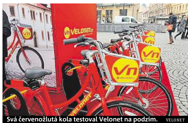
Svá červenožlutá kola testoval Velonet na podzim.