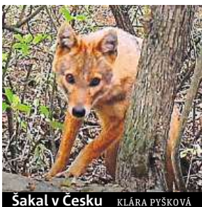
Šakal v Česku Klára Pýšková

až 11 kilogramů, se objevil právě na Šumavě. V osmdesátých letech bylo totiž na bavorské straně Šumavy vypuštěno asi 120 jedinců kočky divoké. Je tak pravděpodobné, že se šelma rozšířila právě odsud.