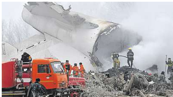
Hasiči likvidují požár po havárii tureckého letadla.

Na místě pádu letadla pracují záchranáři a hasiči. Příčiny neštěstí vyšetřuje speciální komise odborníků pod dohledem premiéra Sooronbaje Žeenbekova. Do vyšetřování nehody se zapojí také turečtí experti. ČTK, MET