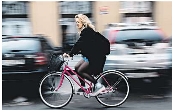
Růžová kola v ulicích už Pražany nepřekvapí.

„Pro nás je důležité provázat službu s Lítačkou, aby to bylo snadno půjčitelné a případně aby byli zvýhodněni držitelé ročních kuponů,“ popisuje Dolínek. ROBERT OPELT