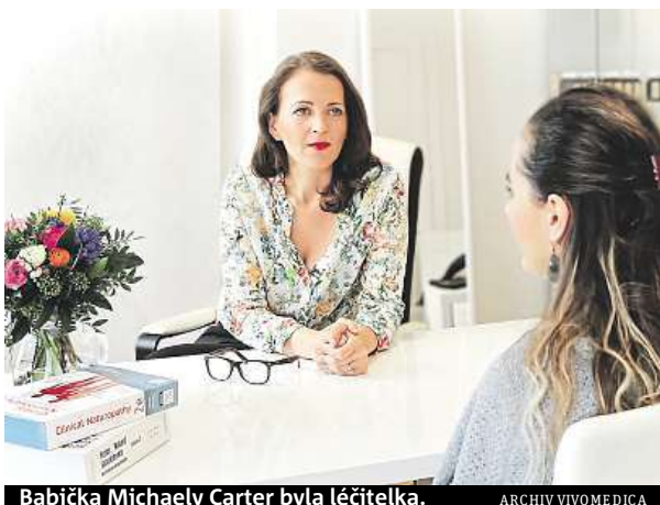
Babička Michaela Carter byla léčitelka.

K tomu vypijte čerstvě vymáčkanou šťávu z pomeranče, mrkve, červené řepy a zázvoru, která dodá tělu