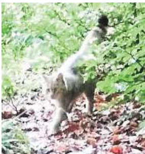
Kočka divoká