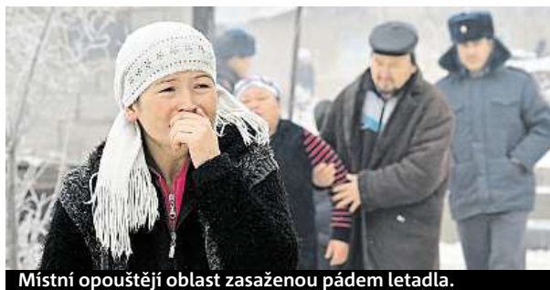
Místní opouštějí oblast zasaženou pádem letadla.