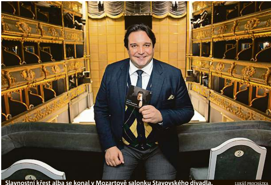
Slavnostní křest alba se konal v Mozartově salonku Stavovského divadla.

Jednoznačně v tom, že mají posluchači šanci slyšet hudbu Mozarta a Salieriho. Posluchači jistě znají z uměleckých děl zpracování, že Salieri Mozartovi záviděl, ale není pro to žádná historická opora. Naopak, v té době neměl Salieri co závidět, protože on byl slavnější, měl prestižnější místo u dvora a jeho opery se hrály více. Ač Mozartova hudba lépe uzrála staletími, v té době neměl Salieri proč být zapřklý. Chtěli jsme z jejich vztahu tedy