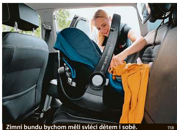
Zimní bundu bychom měli svléci dětem i sobě. TSB

„Pravidlo oblékání platí ostatně i pro dospělé. Bez příliš teplého oblečení se bude za volantem cítit lépe řidič i ostatní spolujezdci. Pás přes hladký povrch bundy může