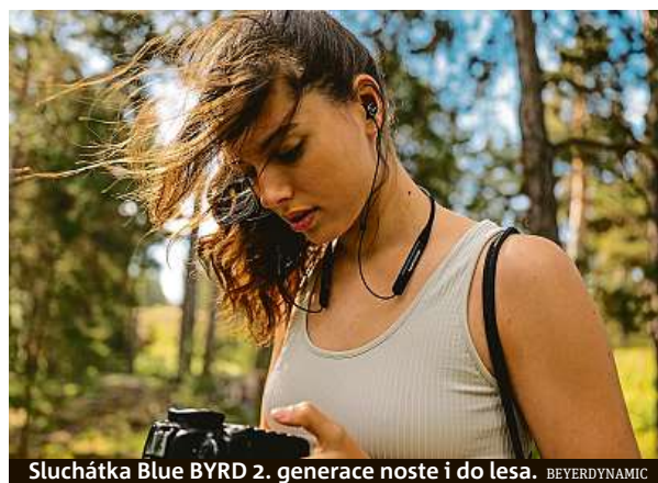
Sluchátka Blue BYRD 2. generace noste i do lesa. BEYERDYNAMIC

„Výsledkem je vyrovnaná reprodukce hudby pro každého uživatele bez ohledu na jeho sluchové vlastnosti,“ vysvětluje pro deník Metro mediální zástupce společnosti Filip Víték a dodává, že lze