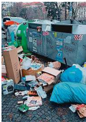
Nepořádek v Praze METRO

Akce platí v prodejních Albat hypermarketech od 15. 12. do 19. 12. 2021 nebo do vyprodání zásob v jednotlivých prodejních. Dvojčíslo množství - porovnávání průměr za období 09. 10. 2021 s průměrem v předchozím období 11. 12. 2021. Každý týden za vás hliáme nejmenší akce na trhu.