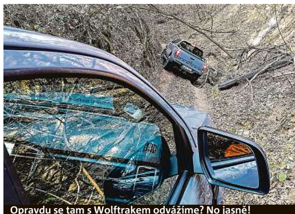
Opravdu se tam s Wolftrakem odvážíme? No jasně!

Model španělského Seatu pojmenovaný po slunném ostrově přijíždí po čtyřech letech s faceliftem. A opravdu mu to sluší – zejména v naší testované rubínové barvě. Vyzkoušeli jsme model FR 1.5 TSI DSG, který stojí na vrcholu nabídky. Na barvu auto nejezdí, samozřejmě. Ale seaty vždycky kladly důraz na výrazný design, který se u Ibizy podařil zachovat. Auto je vedle barvy ostatně krásné i v modernizovaném interiéru, kterému není co vytknout. Patnáctistovka se čtyřmi válci ovšem stojí za více pozornosti. Agilní a svižný motor je spojený výhradně se sedmistupňovým DSG a můžete jej mít pouze v této testované verzi FR, kde cena začíná na 580 tisících korunách. Za ty peníze dostanete auto s vlastní tváří, které je tak trochu „sleeper“. Může se zdát, že jste si koupili hatchback pro dámy, ale prrr! Stovku udělá za 8,2 sekundy, umí to pálit svižně až 216 km/h a v zatáčkách je sebejistý jako dívka z opravdické Ibizy. Vůz pro fanoušky značky, s velkými koly, hezkým designem a stylem. Pak se dá pochopit i vyšší cenovka. METRO – PETR HOLEČEK