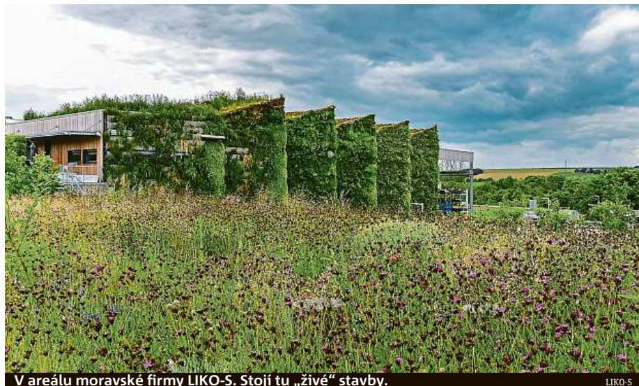
V areálu moravské firmy LIKO-S. Stojí tu „živé“ stavby.

Nadace Partnerství hledá v rámci Adapterra Awards příklady inspirativních projektů, které pomáhají přizpůsobit města, domy a krajinu klimatické změně. Jde například o obnovu polních cest a alejí, ale i o projekty, které mají efektivně nastaveno hospodaření se srážkovou vodou, o nové parky ve městech či o projekty recyklace šedé vody v obytných komplexech. V databázi je nyní přes 110 projektů