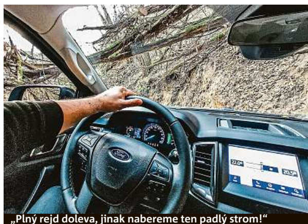
„Plný rejď doleva, jinak nabere ten padlý strom!“