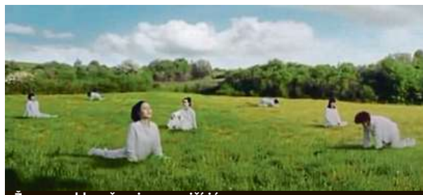
Ženy v reklamě nejprve cvičí jógu. BBC

Nejde o první případ reklamy mlékárny Seoul Milk, který vzbudil široký ohlas. V roce 2003 její jogurt v reklamě propagovali nazí lidé, kteří jogurtem po sobě stríkali. Šéf marketingu i herci v reklamě pak dostali pokutu za obscénnost, uvedla stanice BBC. ČTK