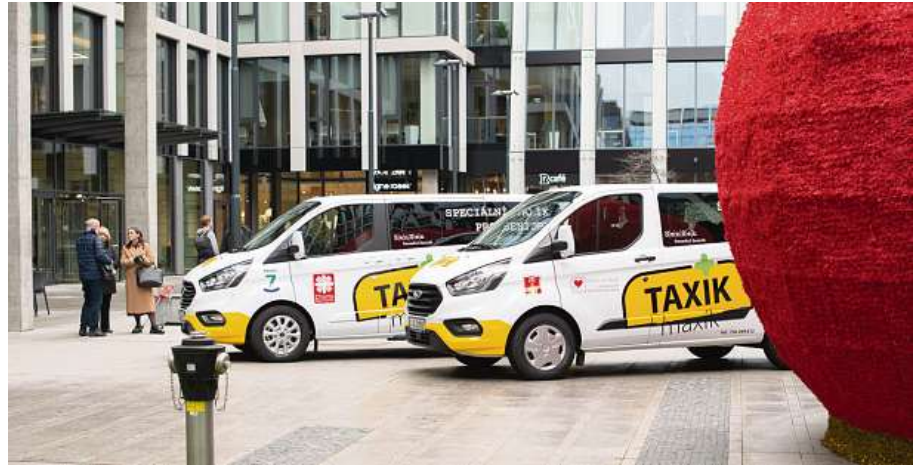
Nové vozy určené pro službu Taxík Maxík v Praze 7 a Havlíčkově Brodu

Už v devatenácti lokalitách ČR mohou senioři a handicapovaní využívat speciální autodopravu Taxík Maxík. Jde o společný projekt lékáren Dr.Max a Konta Bariéry, které při tom úzce spolupracují s městskými úřady a charitativními organizacemi. Od nového roku budou Taxíky Maxíky sloužit potřebným v dalších třech lokalitách.