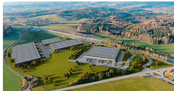
Tak bude vypadat skladovací areál v Ostředku.

větší z hal a jejího přečišťování na pitnou bude dešťovka z ostatních střech a všech zpevněných povrchů sváděna do dalších dvou retenčních nádrží a po stabilizaci se použije na závlahu zeleně v areálu. Firma na pozemku, jenž sloužil jako pole a na němž nebyl jediný strom, vysadí více než stovku stromů nových. Přibudou čmelíny a broukoviště, které mají v areálu zajistit biodiverzitu. MET