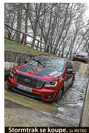
Stormtrak se koupe. 3x METRO