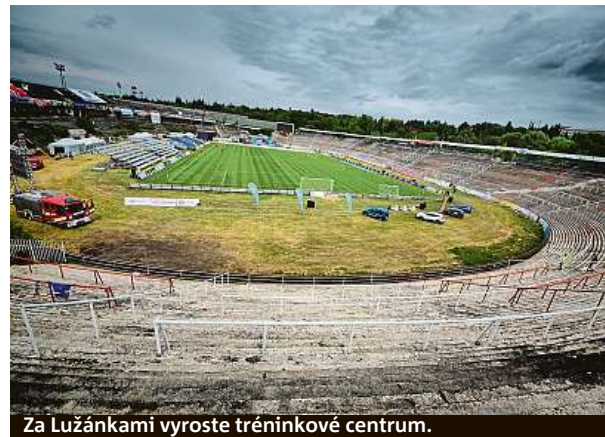
Za Lužánkami vyroste tréninkové centrum.

Dojde k rekonstrukci volejbalového hřiště, úpravě povrchu workoutového hřiště a jeho rozšíření, vybudování lanového centra pro děti a doplnění herních prvků na dobrodružném hřišti Halda. Medlánky tak budou v pohybu v každém věku.