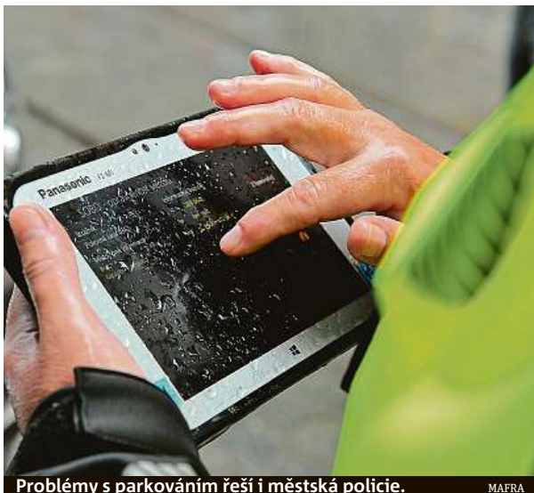
Problémy s parkováním řeší i městská policie.

Společnost měla v roce 2019 kromě jiného ve správě