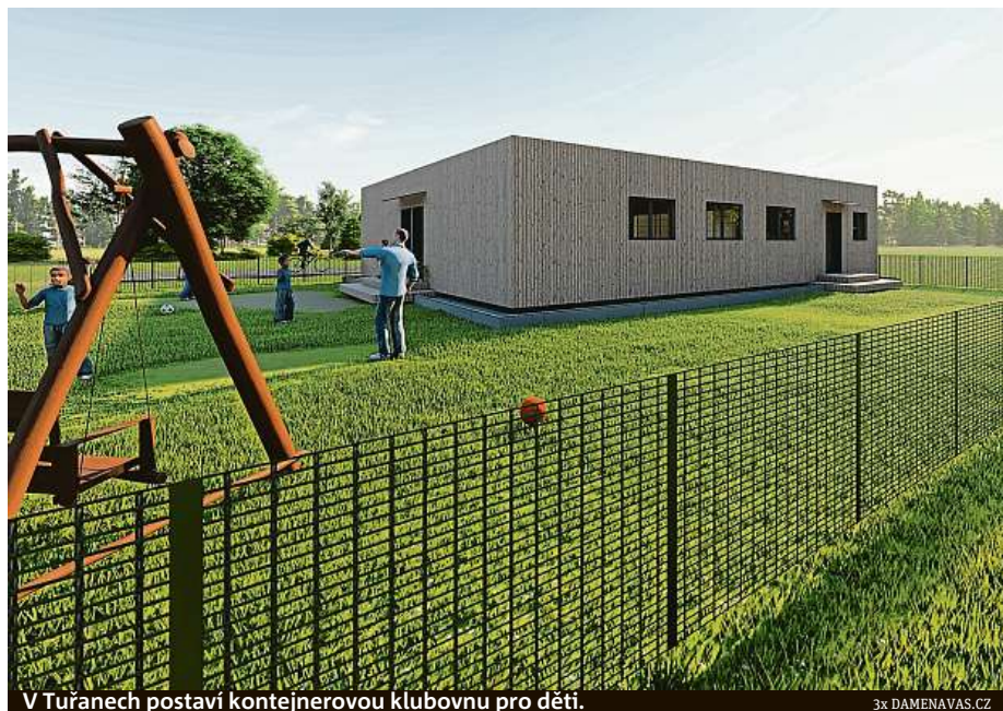
V Tuřanech postaví kontejnerovou klubovnu pro děti.

Zpřístupnění zeleného městského pozemku vedle školky na Škrétově ulici. Část sahající k ulici Terezy Novákové je sice určena k zástavbě, ale díky projektu zůstane zachována jeho druhá část jako zdejší zelená oáza. Stávající zeleň doplní tradiční parková výbava – lavičky, houpačky a odpadkové koše.