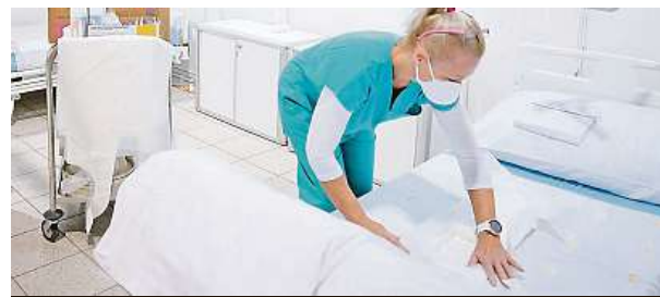
V nemocnici na brněnském výstavišti

Záložní nemocnice je rovněž vybavena množstvím zdravotnického materiálu, jako jsou osobní ochranné