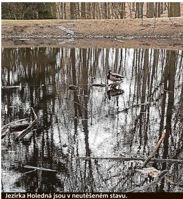
Jezírka Holedná jsou v neutěšeném stavu.

Projekt na záchranu alespoň jednoho z pěti kdysi pěkných jezírek a potůčků brněnské obory Holedná, která bývala zdrojem pitné vody pro