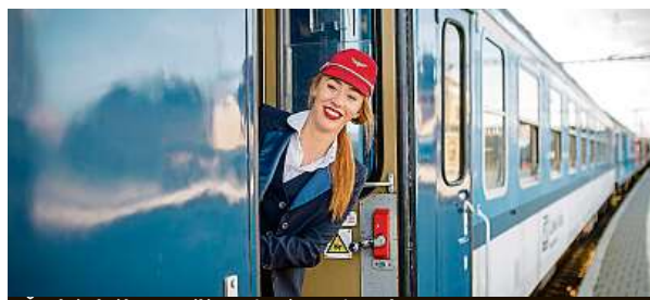
České dráhy posílí spojení mezi Prahou a Brnem.

Dráhy i přesto budou mít devadesátiprocentní podíl na trhu a provozovat budou v průměru 6854 vlaků denně. Dopravce posílí zejména spoje mezi Prahou a Brnem, více vlaků pojedou také na lince ze severu Moravy přes Břeclav do Vídně i na dalších vnitrostátních linkách. Včera bylo také otevřeno brněnské hlavní nádraží po téměř roč-