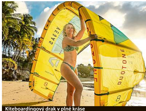
Kiteboardgový drak v plné kráse

Letos jsem byla sedm měsíců v zahraničí a zbytek roku v Čechách. Ročně mám nějakých šest závodů, příští rok jich bude víc. Ale musím po-