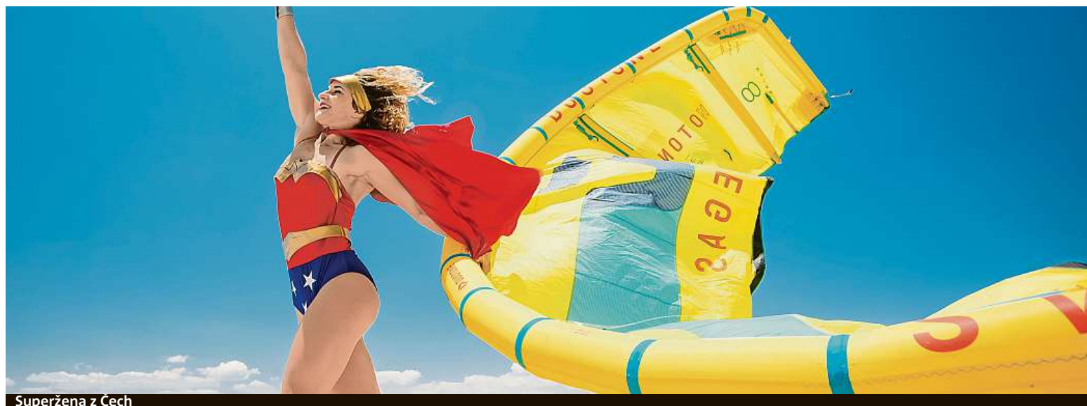
Superžena z Čech