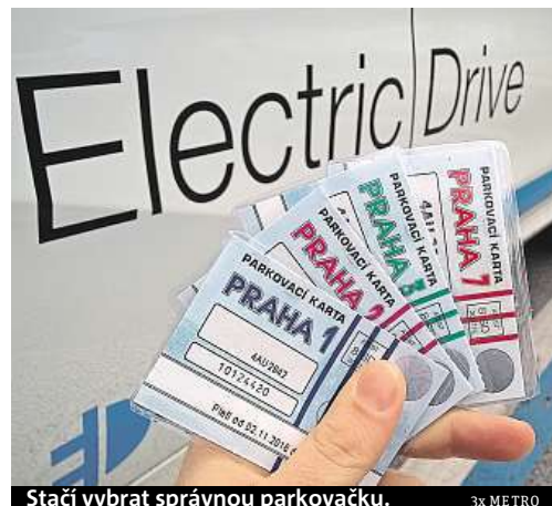
Stačí vybrat správnou parkovačku.