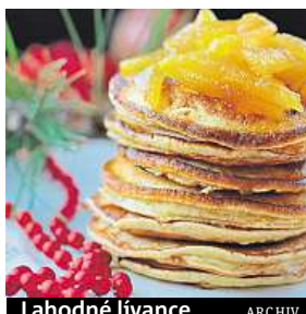
Lahodné lívance ARCHIV

Ingredience: 1 ks Kus-Štrúdlu, 100 g směsi dýňových a slunečnicových semínek, 100 g drce-ných pekanových ořechů, med Postup: Směs vysypete do mísy a přelijte 0,5 l vroucí vody. Po 7 minutách nechte vychladnout. Na suché pánvi opražte nasekaná dýňová a slunečnicová semínka. Pekanové ořechy nejprve krátce opražte na suché pánvi a následně rozdrťte. Vlážný kus osladte dle chuti a přidejte 50 g směsi sekaných semínek a 100 g drce-ných pekanových ořechů. Hmotu zpracujte a tvořte z ní kuličky, které obalujte ve směsi sekaných semínek. Při obalování na kuličky lehce přitlačte, protože semínka nemají tak dobrou přilnavost jako třeba sezam. Každou kuličku uložte do papírového košíčku.