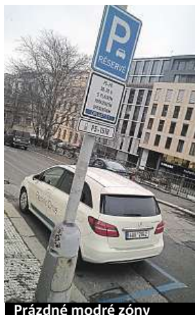
Prázdné modré zóny