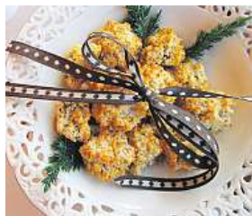
Kokosky medové ARCHIV

Počet porcí: asi 80 kousků, čas přípravy + pečení: 45 minut Ingredience: 1 balení medové jablko LeGracie, 8 bílků, špet-