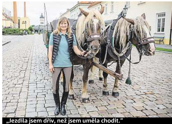
„Jezdila jsem dřív, než jsem uměla chodit.“