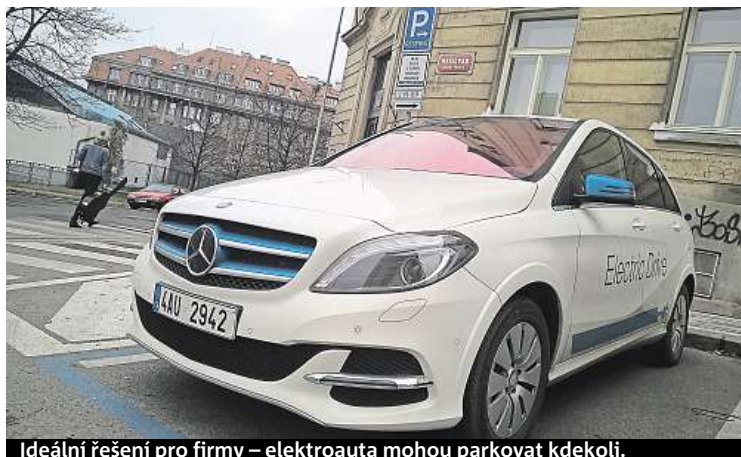
Ideální řešení pro firmy – elektroauta mohou parkovat kdekoli.