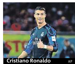
Cristiano Ronaldo