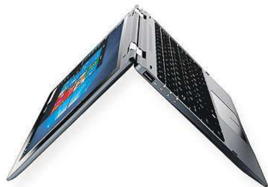
UMAX VisionBook 12Wi Flex

Potěšujících hodnot dosahuje výdrž 9000mAh baterie šplhající až k osmi hodinám provozu na jedno nabití. V základní výbavě je navíc rovnou předinstalován operační systém Windows 10 Home optimalizovaný pro dotykové ovládání, aby vám ihned po vybalení nic nebránilo v tom, nechat se vtáhnout do víru zábavy.