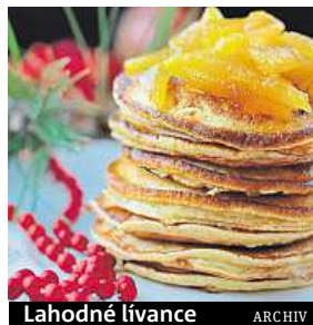
Lahodné lívance ARCHIV

Ingredience: 1 ks Kus-štrdlu, 100 g směsi dýňových a slunečnicových semínek, 100 g drcečných pekanových ořechů, med Postup: Směs vysypte do mísy a přelijte 0,5 l vroucí vody. Po 7 minutách nechte vychladnout. Na suché pánvi opražte nasekaná dýňová a slunečnicová semínka. Pekanové ořechy nejprve krátce opražte na suché pánvi a následně rozdrťte. Vlazný kus osladte dle chuti a přidejte 50 g směsi sekaných semínek a 100 g drcečných pekanových ořechů. Hmotu zpracujte a tvořte z ní kuličky, které obalujte ve směsi sekaných semínek. Při obalování na kuličky lehce přitlačte, protože semínka nemají tak dobrou přilnavost jako třeba sezam. Každou kuličku uložte do papírového košíčku.