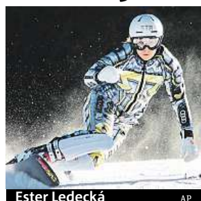
Ester Ledecká

Česká závodnice Ester Ledecká obsadila druhé místo na úvod snowboardové sezony Světového poháru v paralelním obřím slalomu v italské Carezze, kde loni vyhrála. Úřadující vítězku celkového hodnocení paralelních disciplín připravila o sedmou výhru v kariéře ve finálové jízdě o sedm setin sekundy Rakušanka Ina Meschiková. ČTK