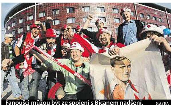
Fanoušci můžou být ze spojení s Bicanem nadšení. MAPRA

„První květen je datum, ke kterému věřím, že budeme vystupovat jako stoprocentní majitelé stadionu. Věděli jsme, že jednání nebudou jednoduchá, byla tu nějaká historie stadionu. Ještě musí být