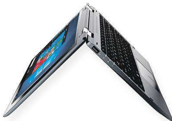
UMAX VisionBook 12Wi Flex

Jeho hlavní přednost spočívá v otočném displeji o 360°, díky němuž lze libovolně měnit režim použití z notebooku na tablet nebo cokoli mezi tím. Úhlopříčka dotykového panelu činí 11,6" a vysokou mobilitu celého zařízení potvrzuje i hmotnost 1,1 kg. Srdcem VisionBooku