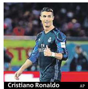
Cristiano Ronaldo