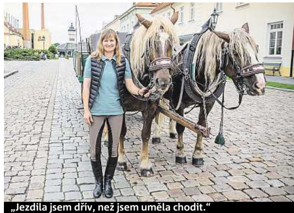
„Jezdila jsem dřív, než jsem uměla chodit.“