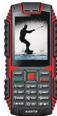
Plave na vodě.

Slot pro dvě SIM karty umožňuje například oddělit soukromý život od pracovního a ve výbavě nechybí ani fotoaparát pro zachycení důležitých momentů, bezdrátová technologie Bluetooth nebo třeba FM rádio.