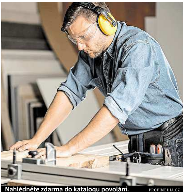
Nahlédněte zdarma do katalogu povolání.

Personalistům poslouží Národní soustava povolání (NSP) jako inspirace při zpracování popisů pracovních míst, sestavování inzerátů na volné pozice či hodnocení a plánování dalšího profesního rozvoje zaměstnanců. Studentům může pomoci při rozhodování o budoucí kariéře a absolventům či nezaměstnaným při hledání uplatnění.