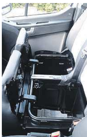
Úložný prostor se skrýval i pod sedadly spolujezdců na předních sedadlech

převrácení. V našem voze nechyběl ani jinde kritizovaný systém ISG (Stop/Start), který má u dodávek zásobujících města své opodstatnění. Co nám naopak chybělo, byla elektronická ruční brzda, která by nám k vozu pasovala lépe. Díky paketu Premium nám nechyběl ani varovný systém vyjetí vozu z jízdního pruhu LDWS, štválo nás však, že i přes jeho vypnutí se po každém nastartování znovu zapnul. H350 se může pochlubit skvělým součinitelem aerodynamického odporu vzduchu pouhých 0,369 Cx, což