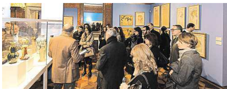
Výstava v Obecním domě byla velmi úspěšná.

kátové tvorby secesního velikána Alfonse Muchy při svém prvním vystavení přilákala do pražského Obecního domu více než 186 tisíc návštěvníků. MET