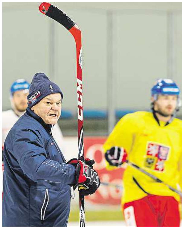
Trenér Vůjtek se svými svěřenci na letňanském ledě ČTK

Krátce před svým slyšením před etickou komisí FIFA se suspendovaný předseda Sepp Blatter obrátil na všech 209 členských zemí Mezinárodní fotbalové federace. V dopise uvedl, že před komisí zítra předstoupí s vírou ve spravedlnost, a varoval před předčasnými závěry o vině, které se objevily v médiích. „Ačkoliv jsem byl suspendován, nejsem izolovaný a jistojistě nebude možné mě umlčet,“ napsal 79letý Blatter. ČTK