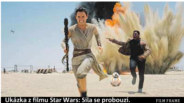
Ukázka z filmu Star Wars: Síla se probouzí.

Sci-fi pohádku mají diváci spojenou především s americkým režisérem a scenáristou Georgem Lucasem, který se podílel na předchozích šesti dílech. Ten aktuální ale natočil J. J. Abrams, který na světové premiéře v Los Angeles poděkoval rodičům, že ho v deseti letech vzali na Hvězdné války. „To byl výborný nápad,“ řekl Abrams.