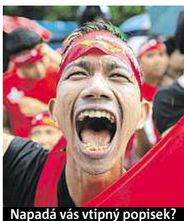
Napadá vás vtipný popisěk?

Napište bublinu a reagujte na sloupek na: www.facebook.com/denikmetro