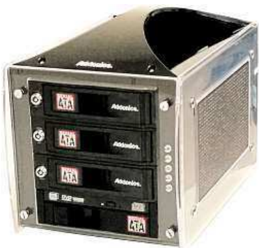
Box, který vám umožní načíst data z různých médií MIRONET

Již od roku 1998, kdy byla zaregistrována v proslulém epicentru světového počítačového a technologického průmyslu – v americkém Silicon Valley – působí v oblasti IT technologií společnost Addonics, pro jejíž výrobky získala na našem území výhradní zastoupení ryze česká firma Dataflex Security. Addonics se zabývá komplexním řešením IT jak pro velké, střední a malé firmy, tak pro běžné uživatele. Mezi jeho devízy