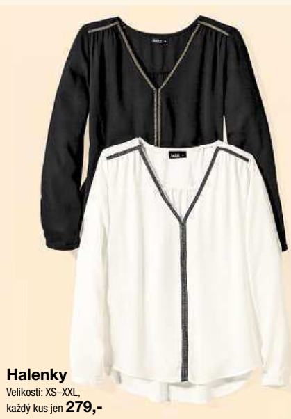
Halenky Velikosti: XS–XXL, každý kus jen 279,-