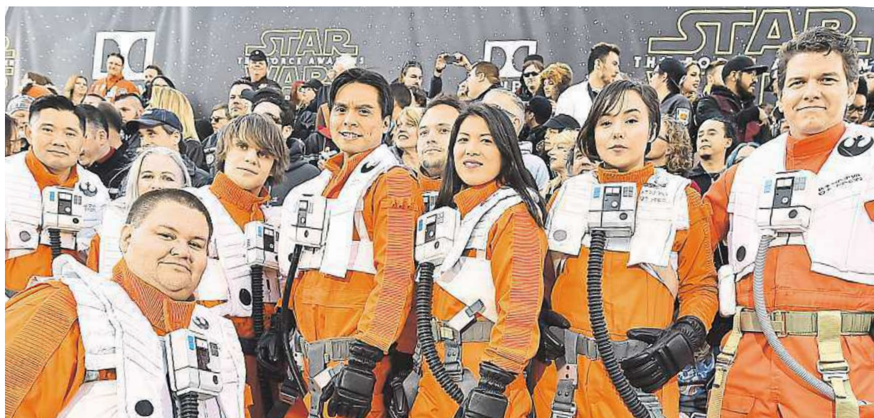
O půlnoci má v kinech premiéru sedmá epizoda americké filmové sci-fi ságy Hvězdné války: Síla se probouzí. Více strana 9 AP

Vybavení veřejných prostranství. Praha plánuje obměnu laviček, zastávek, odpadkových košů i reklamních ploch. Designová soutěž. Vypsána bude už příští rok. Dosavadní správce. Chce s městem jednat STRANA 2