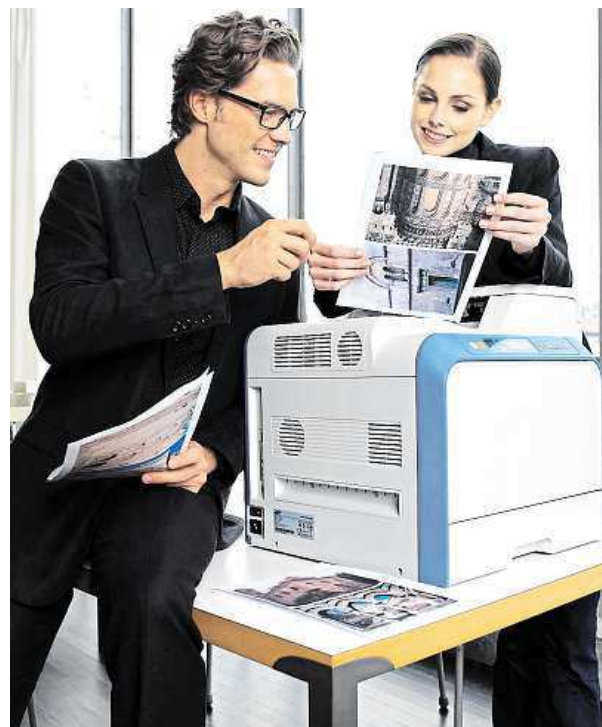
Náplně od značky Peach garantují kvalitu.

Širokou nabídku náplní Peach naleznete v největším IT e-shopu v České republice – Mironetu, kde můžete výhodně pořídit i další kancelářské potřeby této značky, jako jsou například fotopapíry, řezačky, laminovací stroje a fólie nebo třeba vazací papíru. U většiny produktů se navíc při nákupu právě v Mironetu můžete těšit na praktický dárek v podobě LED svítilny. Buďte chytrí a neplaťte za kvalitní tisk a kancelářské potřeby více, než musíte.