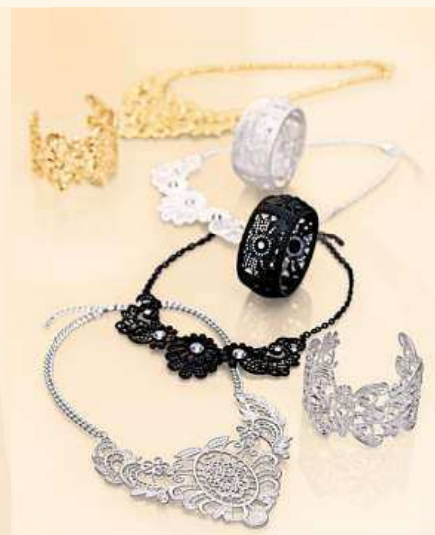
Náhrdelníky Každý kus jen 105,-