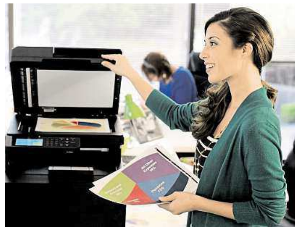
Díky náplním do tiskáren Peach ušetříte.