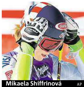
Mikaela Shiffrinová

Nejlepší současná slalomářka Mikaela Shiffrinová má v poraněném koleně natržený postranní vaz. Americká lyžařka, jež chtěla získat čtvrtý malý křišťálový glóbus i záútočit ve Světovém poháru na celkovou trofej, se zranila ve švédském Aare. Diagnózu oznámila na sociálních sítích. Za jak dlouho by se mohla na svahy vrátit, netuší. ČTK