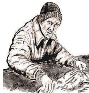
Ilustrace z knihy PŘÍBĚHY (Z) ULICE

Patronkou knihy je Bára Hrzánová, která k projektu natočila i videospot. Každou koupí navíc darujete 50 korun na konkrétního bezdomovce. PUR