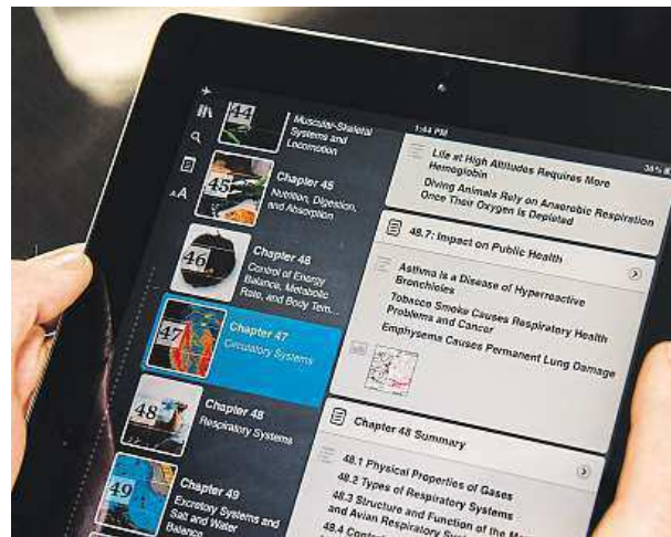
MOOC is a Massive Open Online Course – a new type of course offered completely online to thousands of people.