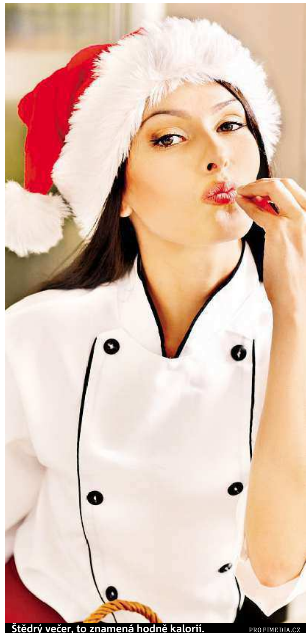
Štědrý večer, to znamená hodně kalorií.