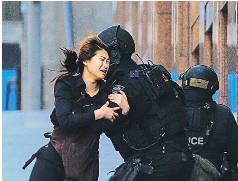
Během dne se podařilo několika zaměstnancům z kavárny utéct.