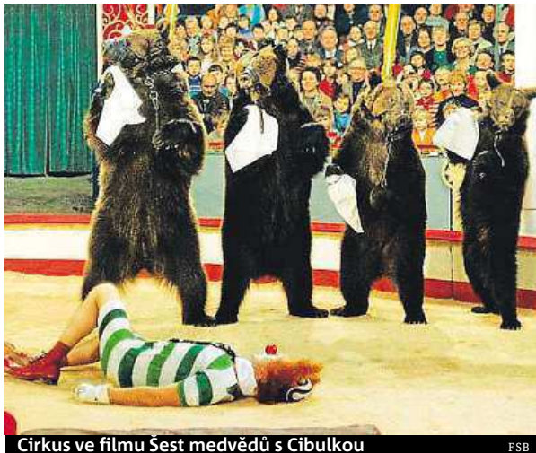
Cirkus ve filmu Šest medvědů s Cibulkou