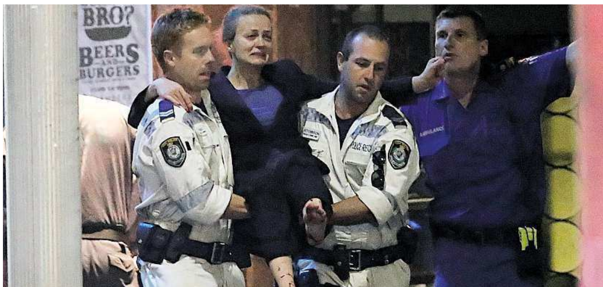
Policejní záchranáři v Sydney vynášejí zraněnou ženu poté, co zneškodnili muže, který zadržoval rukojmí. Více na straně 4

Evropský trend. Medvědi, tygři a další šelmy se v cirkusech stanou ohroženým druhem. Česko. Deset let už tady nevidíte opice, delfíny a hrochy, ale ve Velké Británii a Nizozemsku brzy budou ještě přísnější STRANA 2