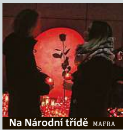
Na Národní třídě MAPRA

Vysokoškoláci uctí 17. listopad 1939 i 1989 na tradičním místě.