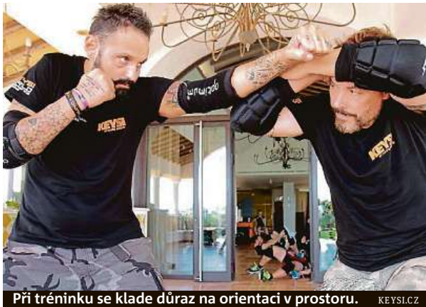
Při tréninku se klade důraz na orientaci v prostoru. KEYSI.CZ

Keysi vytvořil Španěl Justo Dieguez, sám držitel mistrovských pásů v několika bojových uměních. Jenže při potyčkách v realitě španělských diskoték zjistil, že tato umě-